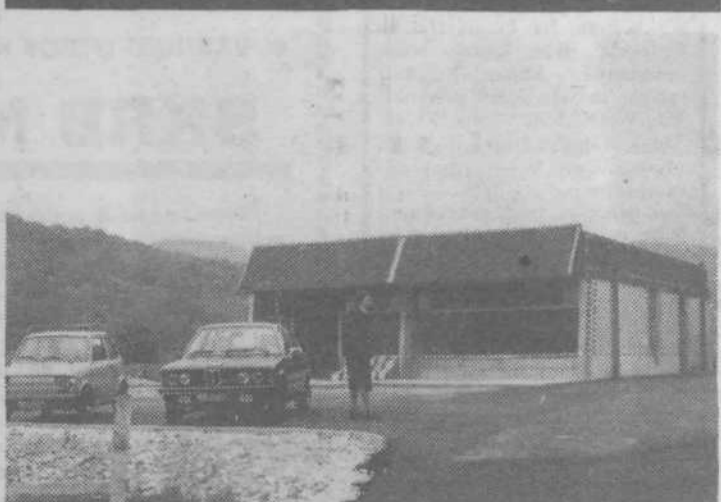
V Senožetih je trgovina Mercator-tozd Golovec že pod streho. Vaščani upajo, da bodo kmalu lahko tudi kupovali v njej. AM