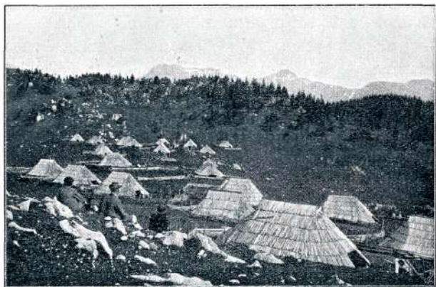
NA MALI PLANINI

Le še enkrat stopiš v redki bukovi gozdič onkraj Pasje peči, kjer se prevale pot čez rob — levo na Planino, desno na Kisovec — potem pa se že viješ