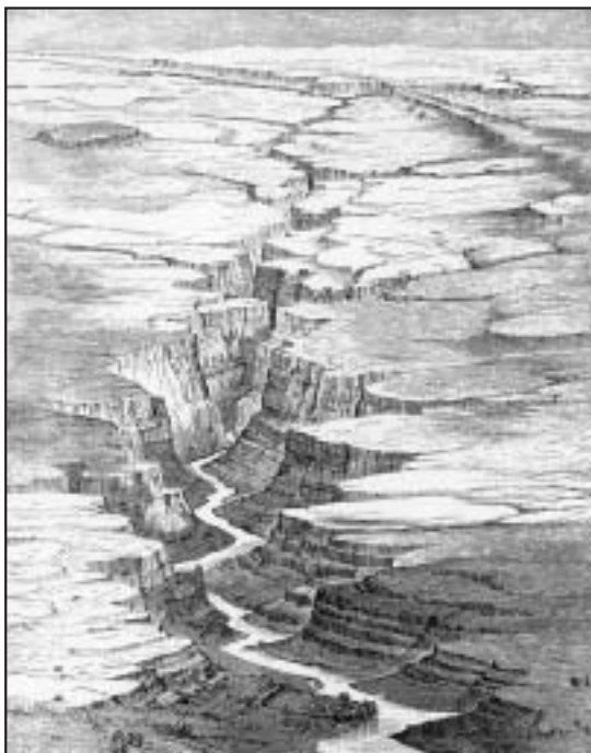
Figure 3: View of Marble canyon from Vermilion cliffs. From Powell, J. W., 1961, The Exploration of the Colorado River and its Canyons. Dover publications, Inc. New York. P. 240.

J. W. Powell je umrl 1902 v Havenu (Maine), daleč od pokrajina, ki jim je posvetil večino svojega življenja.