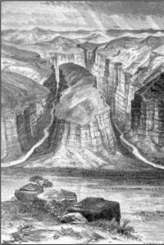
Figure 2: »Hogbacks« with intervening valleys. From Powell, J. W., 1961, The Exploration of the Colorado River and its Canyons . Dover publications, Inc. New York. P. 146.

Slika 2: Hogbeki, strme strukturne stopnje. Iz knjige Powell, J. W., 1961, The Exploration of the Colorado River and its Canyons . Dover publications, Inc. New York. Str. 146.