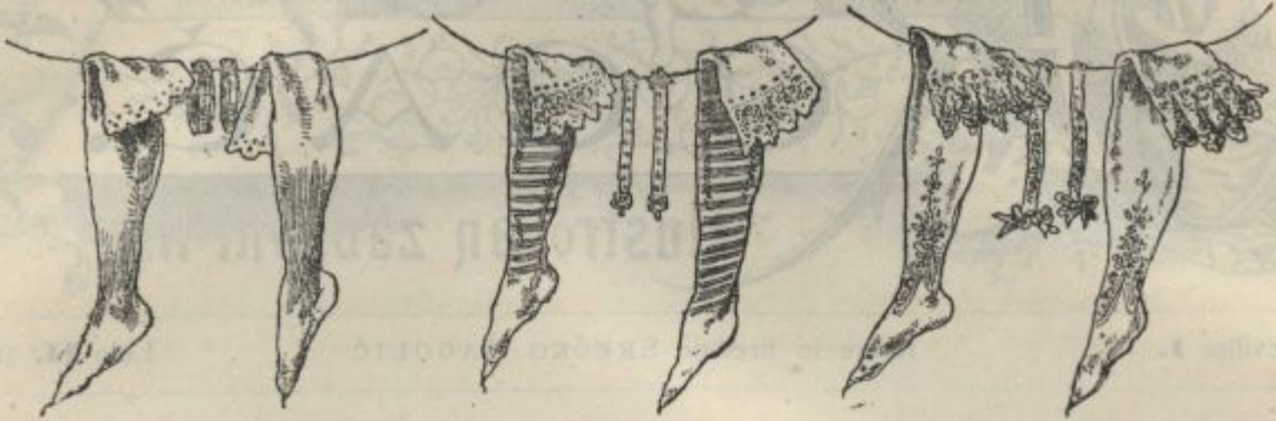
a) mestni odbornik, b) deželni poslanec, c) državni poslanec.