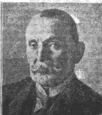
Nikola Uzunović, predsednik vlade

V sredo 18. t. m. so zvečer uradno poročali iz Beograda, da je vlada g. Uzunovića odstopila, na kar je g. Nikola Uzunović sestavil novo vlado, v kateri se nahajajo: