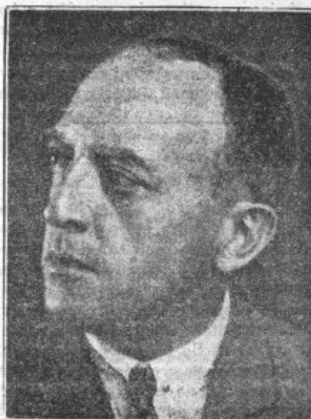
Minister za socialno politiko dr. Fran Novak

predsednik vlade: Nikola Uzunović, kmetijski minister: Dragutin Kojić, prosvetni minister: dr. Ilija Šumenković, pravosodni minister: Boža Maksimović, prometni minister: Svetislav Milosavljević, dosedanji ban Vrbaske banovine, minister za telesno vzgojo: dr. Grga Angje- linović, finančni minister: dr. Milovan Gjorgjević, minister za trgovino in industrijo: Juraj Demetrović, zunanji minister: Bogoljub Jevtić, notranji minister: Živojin Lazić,