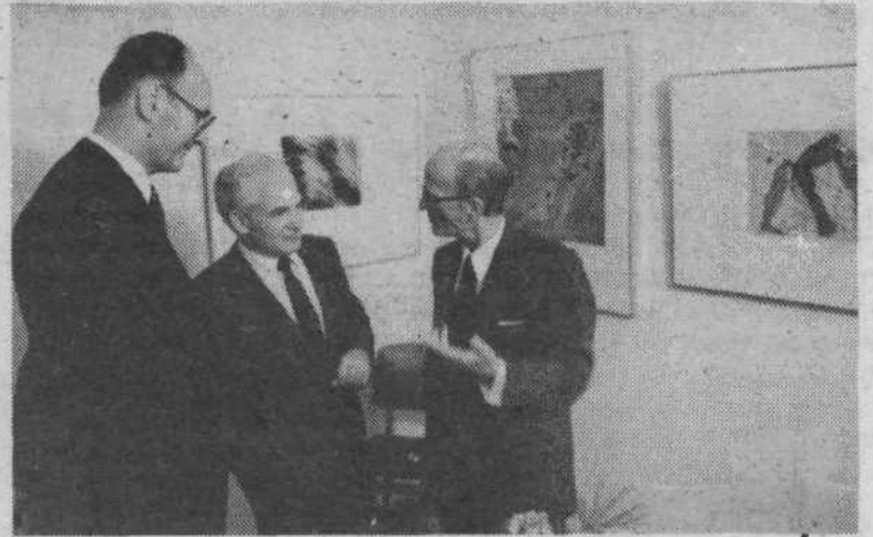
Z otvoritve razstavnega prostora v KS Gradišče.