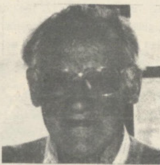
ŽPK. TOMAŽ HOLMAR, OBIRSKO