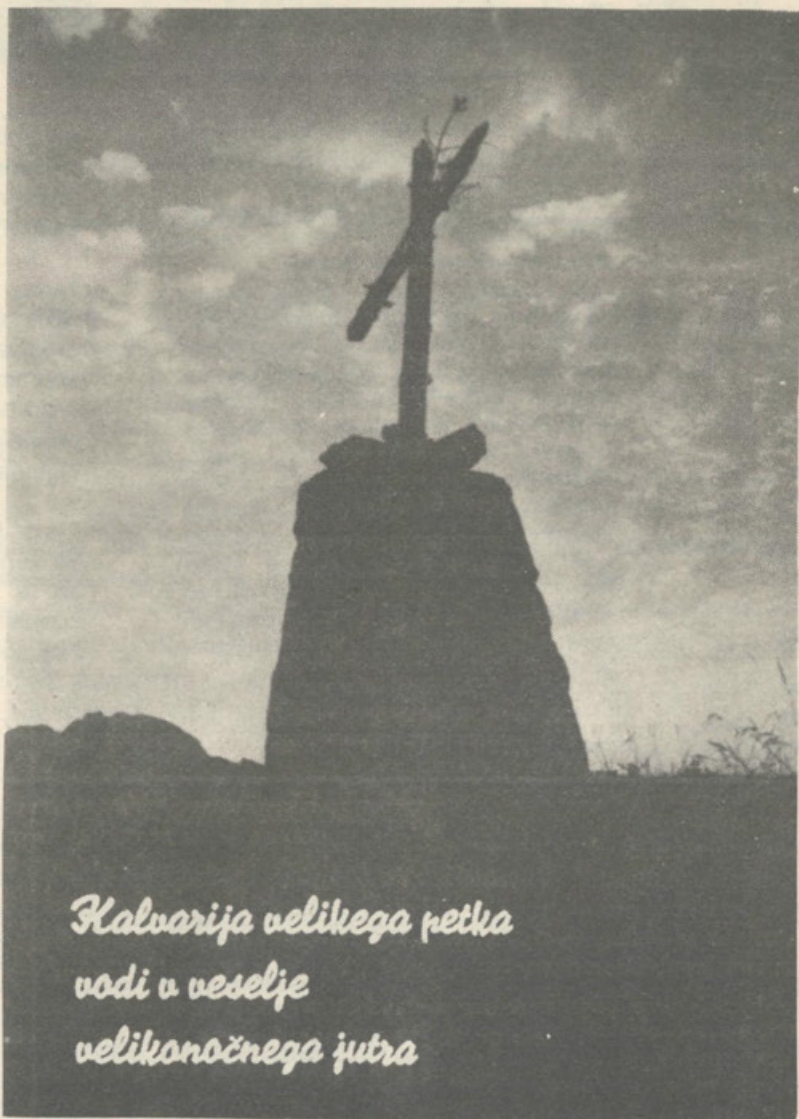
Kalvarija velikega petka vodi v veselje velikonočnega jutra

Papež Janez Pavel 2. je v postnem času prvič obiskal Sveto deželo in je iz Gore Nebo blizu Galilejskega jezera oživljal tisočletim množicam Jezusove Besede, ki jih je skoraj pred 2000 leti govoril Gospod o smrti človeštva.