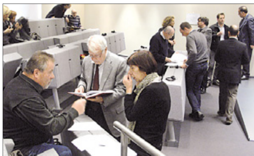
Arhivski posnetek posvetovalne komisije FJK za Slovence