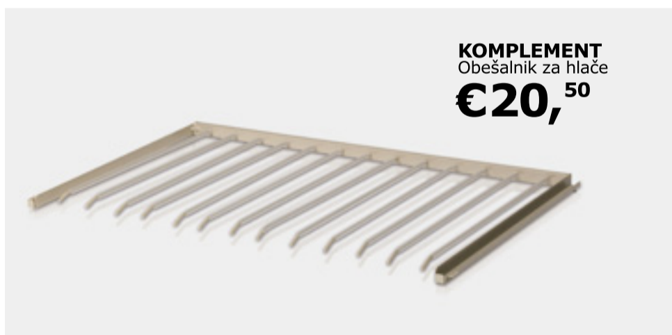
KOMPLEMENT Obešalnik za hlače €20, 50