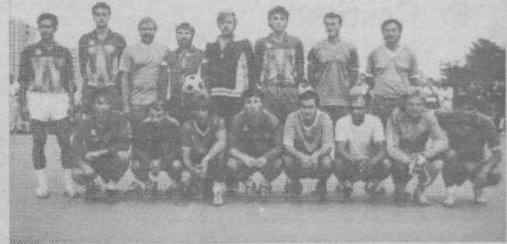
Na sliki sta finalista turnirja Mercator Sadje-zelenjava 88 na Fužinah ekipi KMN Vukosavljevič in Šaljivci

Besedilo: DUŠAN STOJČIČ-STOLE