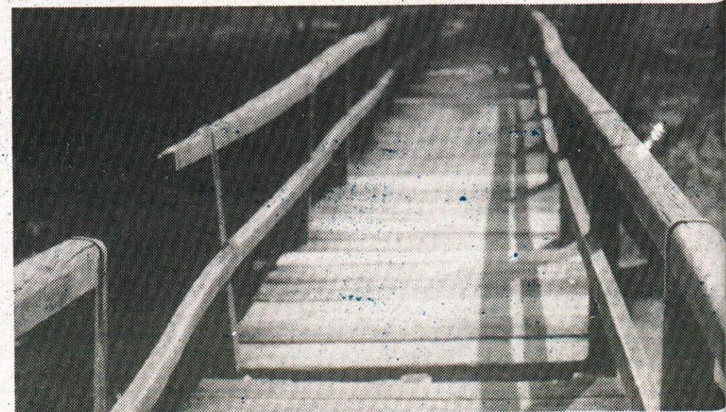
Most v Retovju, ki je zelo blizu Maroltove žage, pa komaj čaka na prvi žagan les;