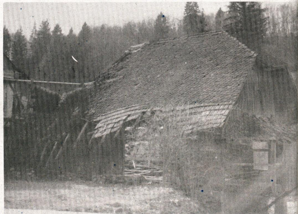
Stara Maroltova žaga tik pred tem, da bo začela ponovno delovati, samo še nekaj adaptacij je potrebno