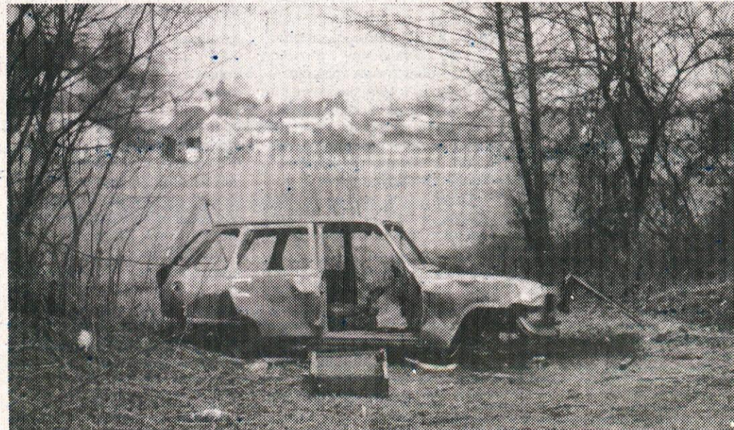
Nov parkirni prostor ali nova delavnica avtokleparja pri obeh skakalnicah v Borovnici;