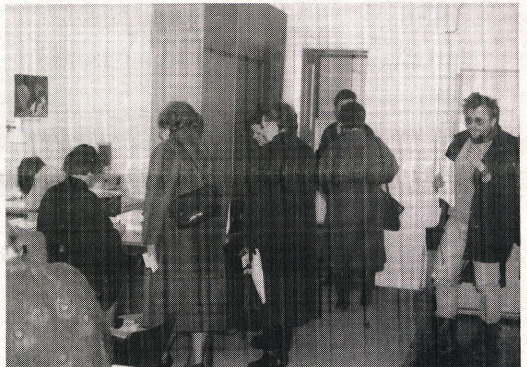
Nekoliko večja vrsta je bila 30. in 31. marca na davčni upravi