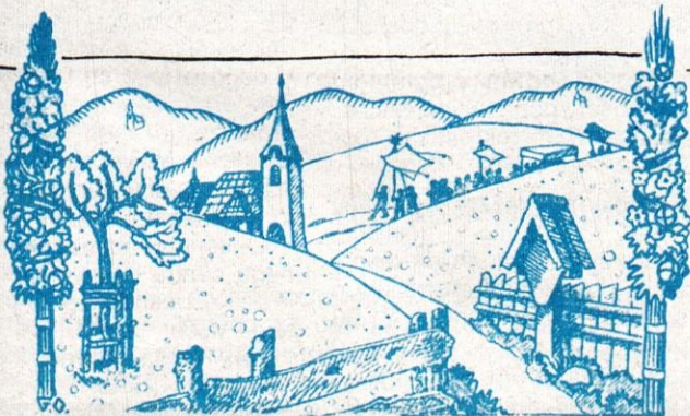
Oton Gaspari: Velikonočna procesija