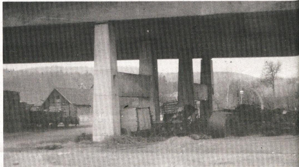
Avtocesta je dobra streha za marsikatero uporabno in neuporabno kmetijsko mehanizacijo