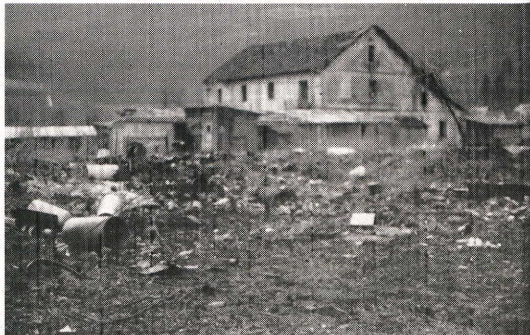
Blizu vodnega zajetja v Borovnici pa nastaja veliko črno odlagališče