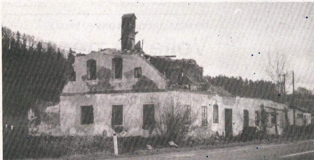
Ob katastrofalni stari regionalni cesti proti Ljubljani je prav tako stara hiša, bolj rečeno podrtija