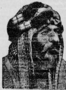
Ibn Saud, kralj v Iraku v Arabiji, bi bil kmalu postal žrtev atentata pred največjim turskim svetiščem v Meki, kamor je prišel na božjo pot. Le srečnemu naključju in hladnokrvnosti se ima zahvaliti, da je ostal pri življenju.

Stoletnica podlistka. Nedavno je poteklo sto let, odkar so začeli časopisi prinašati v podlistkih romane. Ta navada se je začela na Francoskem in znana francosko pisateljca Evgen Sue in Aleksander Duma sta bila prva, ki sta se odlikovala s takimi romani, katere so bralci časopisov hlastno prebirali. Počasi se je navada razširila in danes prinesejo časopisi Anglije, Francije in Nemčije na svojih straneh nad 120.000 romanov v enem letu.