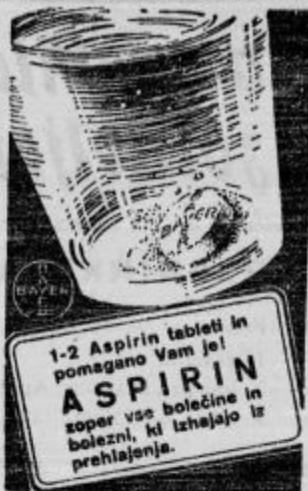
Opomba: vsa razp. pod št. 22902 od 22. III. 1934.

20.000 ljudi je utonilo pri poplavi kitajske Rumene reke.