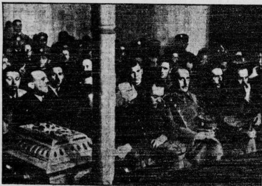
Po grški revoluciji. Ko je vlada premagala upornike in vzpostavila red, so začela poslovati sodišča, kjer bodo prejeti občutno kazni zlasti častniki, ki so se pridružili upornikom. Naša slika nam kaže skupino grških častnikov med sodno obravnavo.

Stoletnica podlistka. Nedavno je poteklo sto let, odkar so začeli časopisi prinašati v podlistkih romane. Ta navada se je začela na Francoskem in znana francosko pisateljca Evgen Sue in Aleksander Duma sta bila prva, ki sta se odlikovala s takimi romani, katere so bralci časopisov hlastno prebirali. Počasi se je navada razširila in danes prinesejo časopisi Anglije, Francije in Nemčije na svojih straneh nad 120.000 romanov v enem letu.