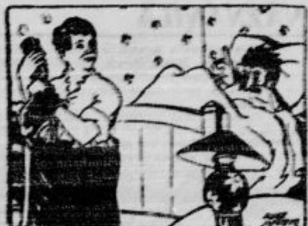
Francoski vsleraj klubov.

Nad svetovno vsjeto je bilo nad Londonom 25 podalnih napadov. Vsaka skupaj je padlo na meso 822 bomb, ubitih je bilo 264 ljudi, ranjenih je 1264.