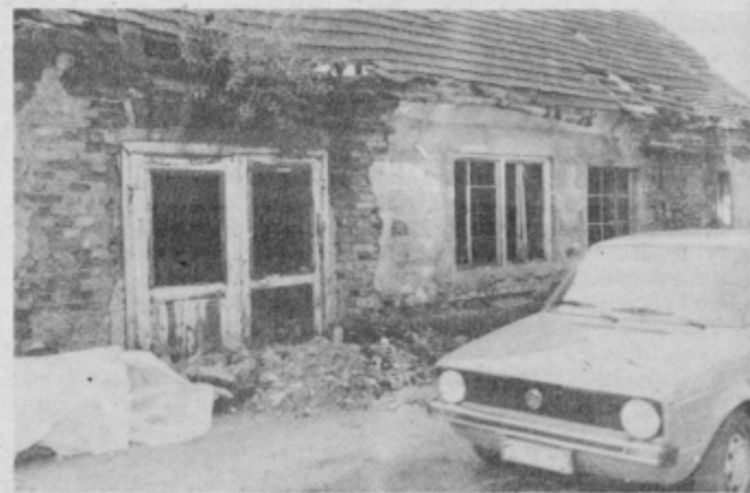
Obstaja nevarnost, da se trhlo ostreže nekdanje kovačije zruši na Rogaško cesto.