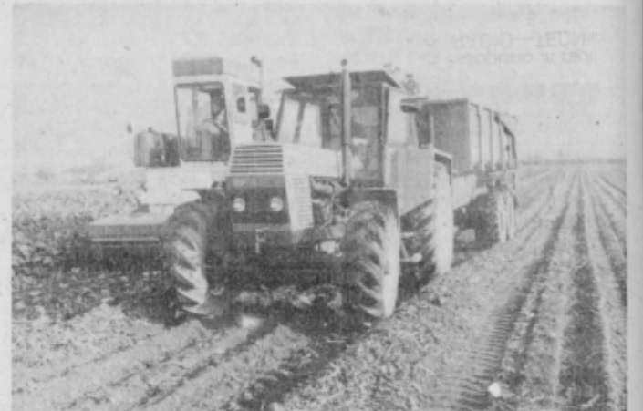
Na poljih EKK Ptuj v delovni enoti Turnišče so pričeli s spravilom sladkorne pese že prejšnji teden