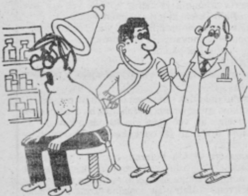
— Kakšni znaki, kolega? — Hm, težko reči. Pravi, da se strašno slabo počuti odkar mora živeti samo od plače.