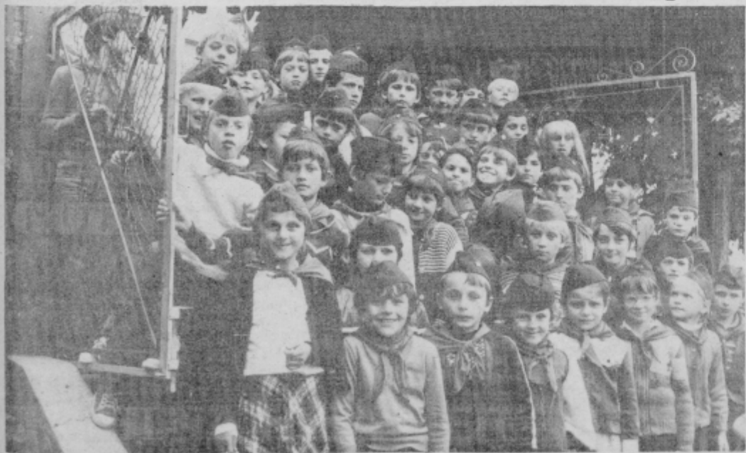
Smu Titovi pionirji, saj hodimo po Titovi poti s Titom v srce

Spominski dan, 29. september, ko je bila ustanovljena Zveza pionirjev Jugoslavije, je bil tudi letos priložnost za kratek pregled opravljenega dela v šolskem letu 1983/84 in za sprejem programa dela pionirske organizacije v letu, ki se je šele začelo. Priložnost za dogovor — kako bodo pionirji vse leto delali, ustvarjali, se veselili in izpolnjevali naloge iz programa XIV. jugoslovanskih pionirskih iger z naslovom RASTEMO POD TITOVO ZASTAVO.