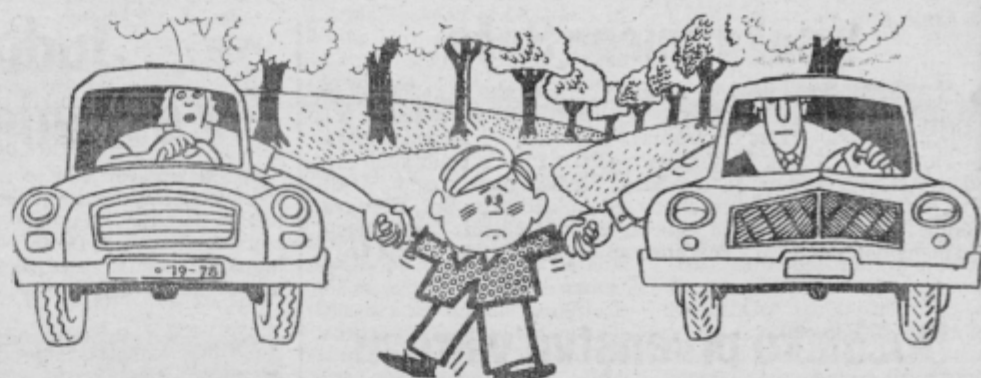
Tako sta me starša učila hoditi, sedaj pa mi očitata, da nisem skromen in ne znam varčevati.