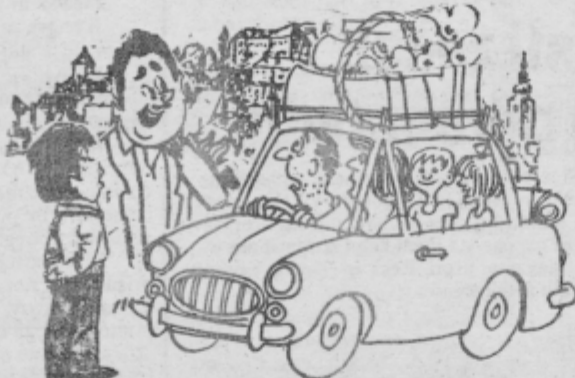
— Se vračate s počitnic? — Kje pa, le ozimnico smo nabirali!