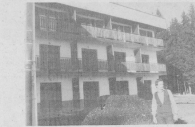
Vodja RTC Trije kralji Brane Strehar ob kupu premoga pred depandansko trokat z večjim optimizmom pričakuje zimo.

uspeli urediti okolje doma in pripraviti tudi skupno okoli dvajset hektarjev zemljišč za smučišča.