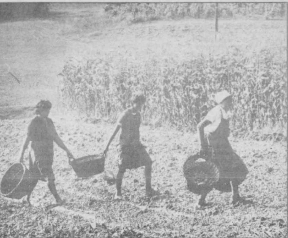
Za danes je delo opravljeno ...

Odvrgel je cigareto me pogledal in rekel lahko noč. Strmela sem v temno noč in nebo sem občudovala. Bilo je jasno tu pa tam se je speljal utrinek, in preletel zvezdnato nebo. Počasi sem se obrnila in z neprozornimi mislimi odšla proti domu. Kaj sem mu storila, ne vem. Kaj je mislil on, ne vem. Edino to vem, da me je zapustil.