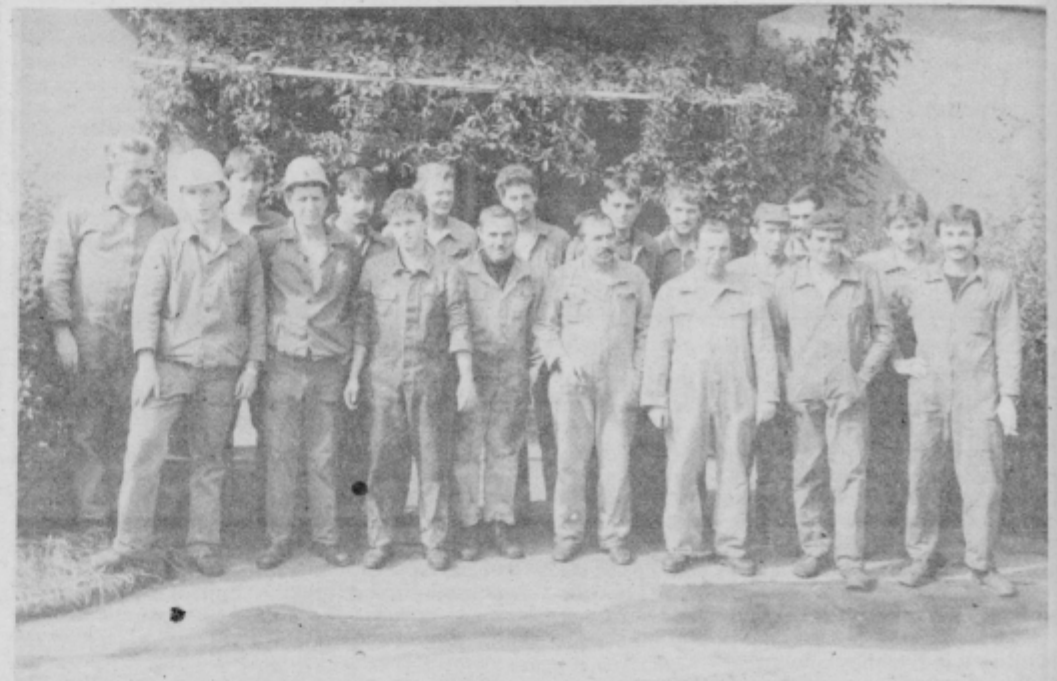
Ob našem obisku smo ujeli v objektiv sedajno skupino delavcev obrata anodne mase. Trije iz prejšnje skupine, ki je prejela plaketo občine so že v pokojju, eden pa je bil ta dan na dopustu.

«Naše delovne pogoje bi lahko primerjali brez skrbi s tistimi v