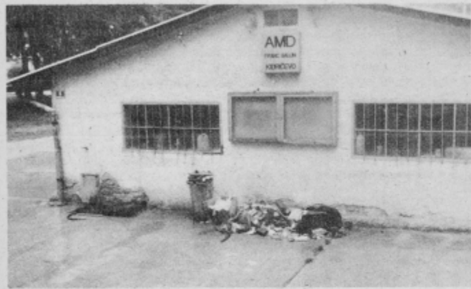
Smetišče ob pralnici avtomobilov v Kidričevem