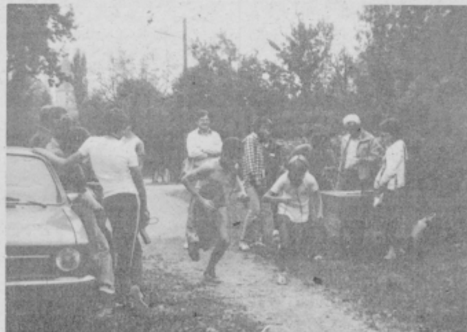
Start ali juriš na „lisice“.