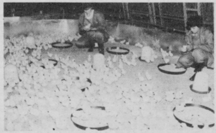
Utrinek iz življenja in dela na perutninski farmi.

Začetne težave ob zagonu so v glavnem odpravili še pred vhljevitvijo starih staršev. Delavci na farmi pa se zavedajo odgovornosti do velikih družbenih sredstev s katerimi delajo in ki so jim bila zaupana v upravljanje.