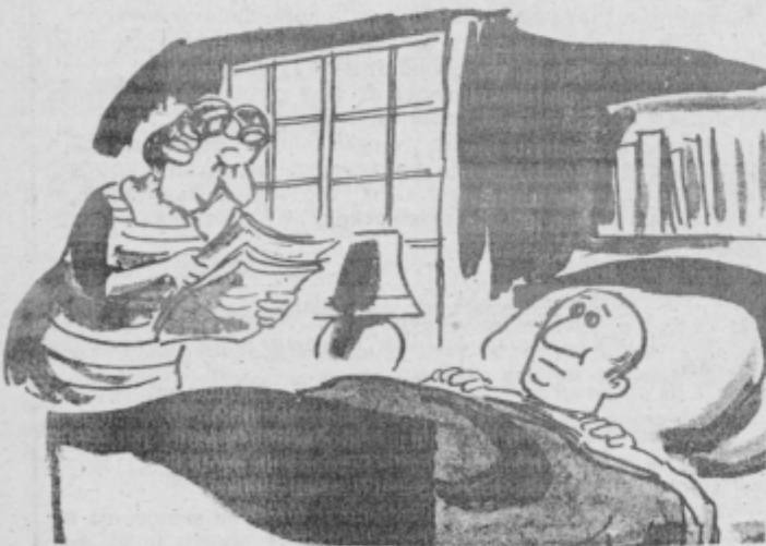
Vidiš, da si že čisto na kraju Tonek, zato te prosim, da se opredeliš za nadaljevanje zavarovanja po zakonu o starostnem zavarovanju kmetov v šestih pokojninski osnovi.