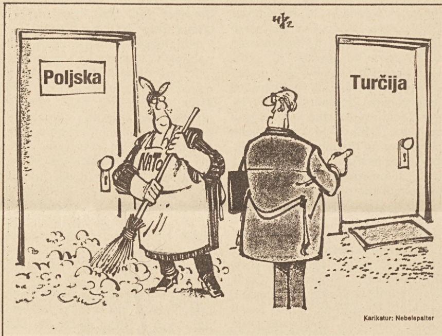
„In kaj je z gnojem pred temi vrati?“

Spominske svečanosti v Svečah so se na povabilo Zveze koroških partizanov udeležili med drugim zastopniki slovenskih organizacij ter generalni konzul SFR Jugoslavije v Celovcu.