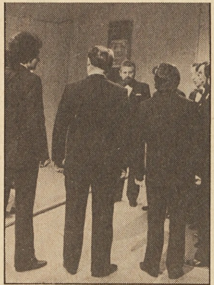
Ko so v Celovcu odprli kulturni dom, je na slavnostni akademiji sodeloval tudi znani oktet iz Slovenije „Alpen-Adria“. Kot lahko s pomočjo naše slike ugotovite, poje pri slovenskem oktetu „Alpen-Adria“ tudi koroški deželni glavar Leopold Wagner.

Čudeži se godijo v naši lepi domovini Karantaciji. Danes, na dan „tolstega četrta 1982“ so v Celovcu slavnostno odprli slovenski Kulturni dom. 8 (osem) let smo morali čakati na ta dan, pa smo ga le dočakali.