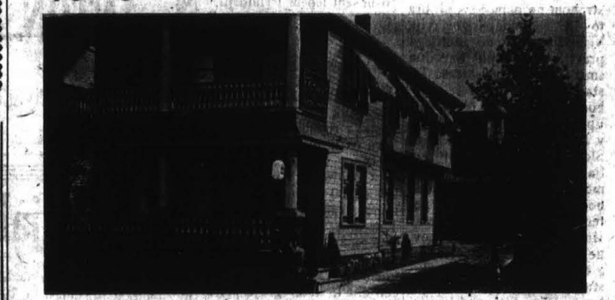
Pogrebni zavod A. Grdina bo poročal tudi o drugih umrlih, in je vselej pripravljen točno in vestno postreči vsem. Priporoča se naklonjenosti rojakov. A. GRDINA, SLOVENSKI POGREBNI ZAVOD. 1053 E. 62nd ST.