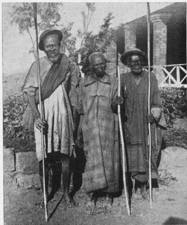
Čeprav stari, pa polni veselja gremo v misijon k božičnim praznikom.

Ob 2. uri moram zopet nazaj v Taungs, da imam tam popoldansko službo božjo, ki se konča ob 4. Pred