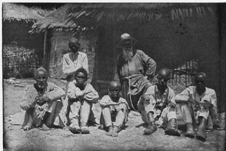
Misijonar v sredi ubogih gobavih.

Ko mi katehist to sporoči, se sam odpravim k temu staremu zagrizenemu paganu. Spotoma molim rožni venec, kakor vselej, kadar grem h hudo bolnemu. To mi je še