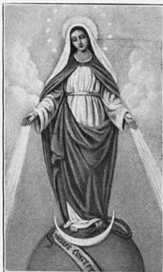
Slava Ti, o Brezmadežna!

Drugič: Marsikateri deklici je onemogočen poklic redovnice le vsled svoje ali misijonarjeve revščine. Poganski stariši so jo že v zgodnji mladosti prodali kakemu poligamu (t. j. takemu ki ima več žen); to vsoto je treba starišem nadomestiti. Prispevaj Klaverjevi družbi „za odkup“ takih deklic, ki bi rade v spremstvu Marije „sledile Jagnjetu“! To je apostolsko! To se pravi praktično, dejansko častiti Marijo.