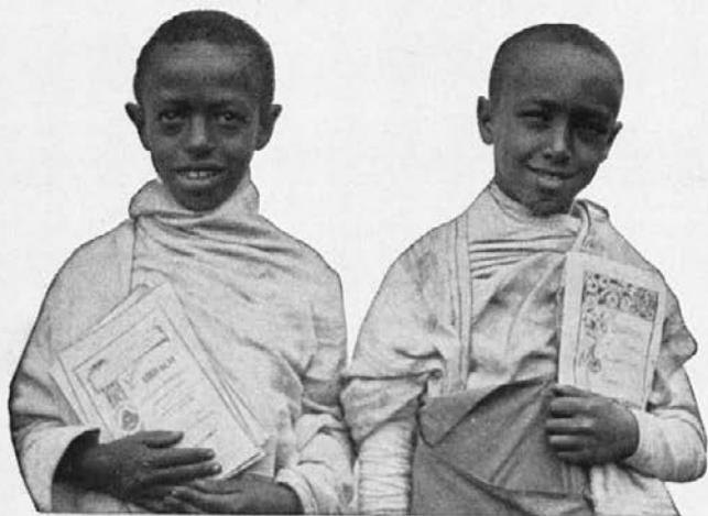
Zamorski dečki srečni, da so si mogli med počitnicami prisluziti svojo obleko.