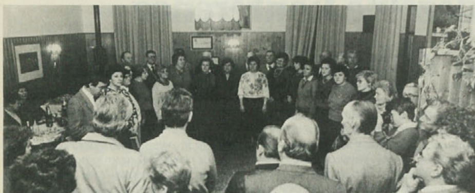
V soboto so v Miljah odprli sedež zadružne gostilne, ki bo še eno zbirališče za Slovence miljske občine.