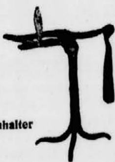
Alter eiserner Kienspanhalter mit Klemmvorrichtung

Man gewöhnt sich an Vorzüge so schnell, daß sie schließlich ganz selbstverständlich erscheinen. Die Vorzüge unserer elektrischen Beleuchtung z. B. nehmen wir hin, als sei das immer so gewesen. Dabei liegt die Zeit garnicht so weit zurück, als auf dem Lande noch der brennende Kienspan das übliche Leuchtmittel war.