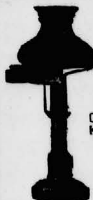
Oel-Luchte mit seitlichem Kanalster

Nicht viel besser als jenes Kerzenlicht war auch das der Oellampe. Anfangs wurde zähes, dickflüssiges Öl in eine offene Schale gegossen und ein