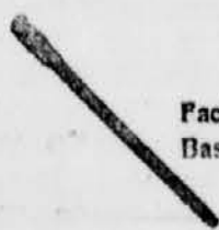
Fackel aus pechgetränktem Bast

Jahrtausendlang diente den Völkern auch der am oberen Ende mit Fett, spä-