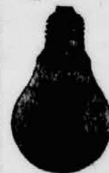
Neuzzeitliche Glühlampe. innenmatiert

Vom Kienspan zum elektrischen Licht! Ein jahrtausendelanger Weg, dessen letzte Stadien in verhältnismäßig schneller Folge zu einer Vollkommenheit führten,