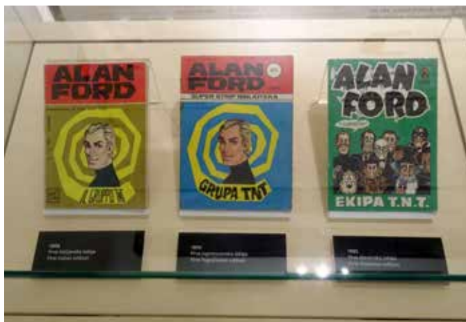
Slika 1: Na razstavi razstavljene naslovnice prve italijanske (1969), jugoslovanske (1970) in slovenske (1993) izdaje Alana Forda.

Gre za risbe, svojevrstne kombinacije med realizmom in karikaturjo, ki jih je med letoma 1969 in 1975 za prvih 75 delov te stripovske serije narisal njen prvotni soavtor, italijanski ilustrator Roberto Raviola, bolj znan pod psevdonimom Magnus. Slednji se je nato posvetil drugim projektom, medtem ko je scenarist Luciano Secchi (z umetniškim imenom Max Bunker) z ustvarjanjem Alana Forda nadaljeval, vendar z drugimi risarji.