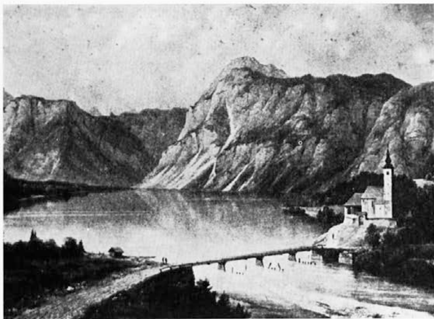
159 Marko Pernhart : Bohinjsko jezero, originalna fotografija-reprodukcija, okoli 1865, zasebna last