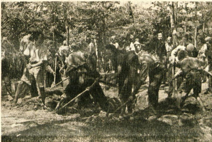
Novomeščani na delovnih akcijah

Tako nekako bodo potekali naši delovni dnevi vse do končne zmage. Marsikaj bomo še izpopolnili; vemo tudi, da se bo hrana