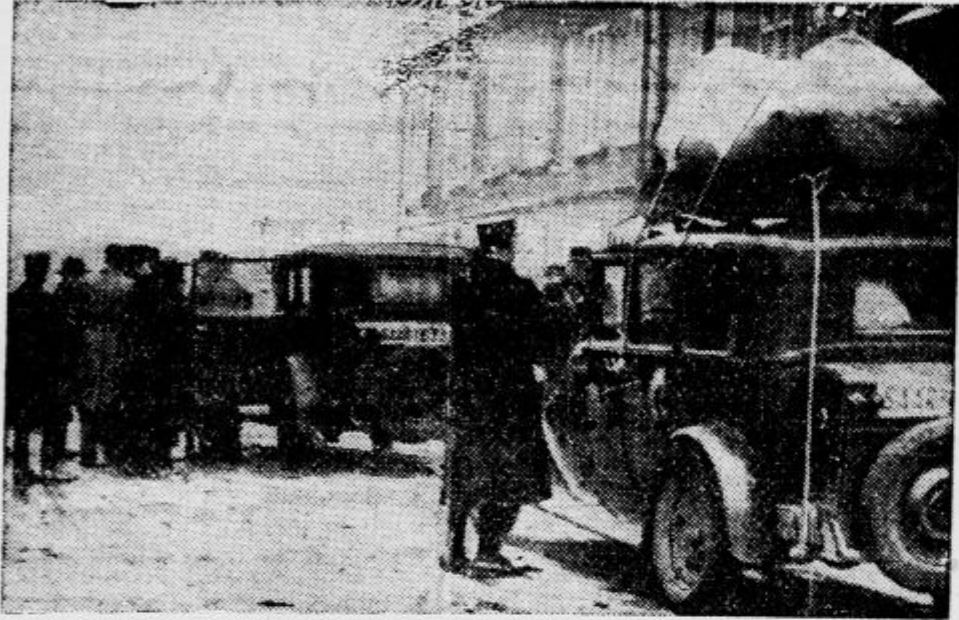
Kontrola avtomobilov na posaarsko-francoski meji, kamor se vsak dan usmerjajo nove skupine emigrantov