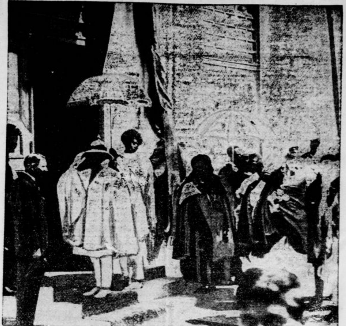
V Adis Abebi, prestolnici Abesinije, so nedavno z velikimi svečanostmi blagoslovili novo poslopje za parlament v navzočnosti abesinskega cesarja in princev