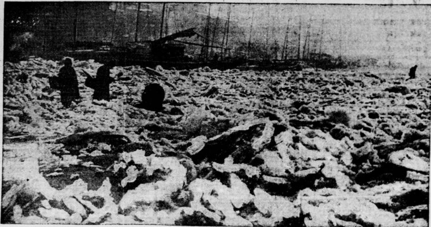
Kitajski Yang Tse Klang povzroča, kadar zamrzne, ljudem in plovbi resne težave. Ledne grude onemogočajo na reki vsak promet