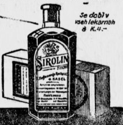
Se dobi v vseh lekarnah & K. 4.-