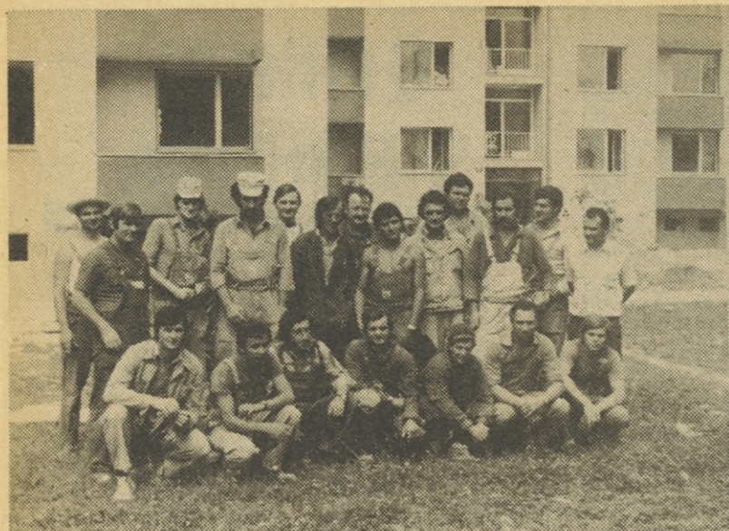
Skupina električarjev na gradbišču v Brežicah