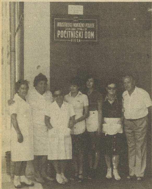
Ekipa, ki skrbi za dobro počutje gostov v Fiesi

žena Omahen, ki pravi tudi, da se v Fiesi počuti kot doma. Jasno je, da povsod, kjer dela skupaj več ljudi, prihaja do posameznih težav, ki pa na rezultate dela ne smejo vplivati.