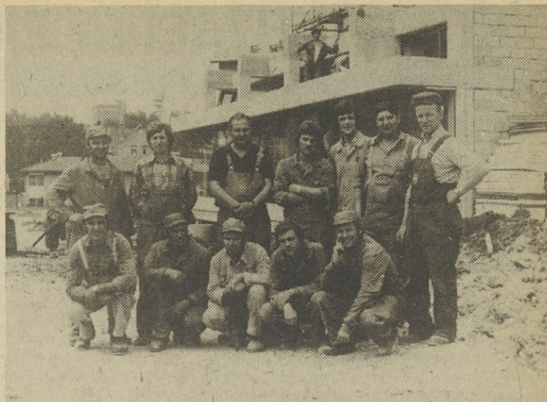
Skupina mariborskih monterjev pred hotelom v Krškem