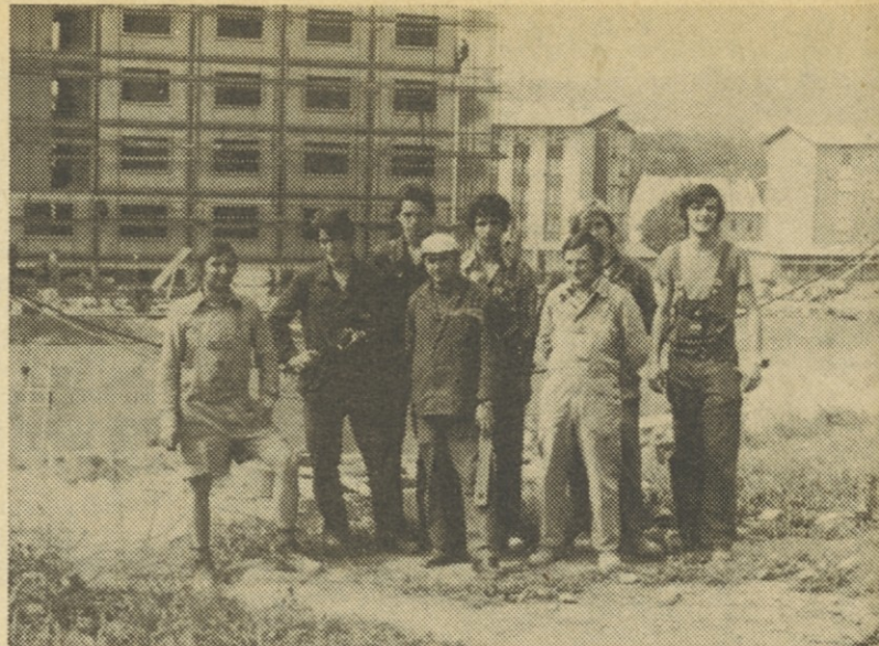
Monterji Elektromontaže pred hotelom Sremič v Krškem