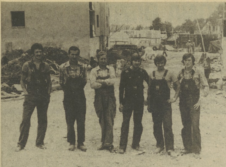
Skupina elektrimonterjev, ki so elektroinstalacije montirali v novozgrajene bloke v Krškem