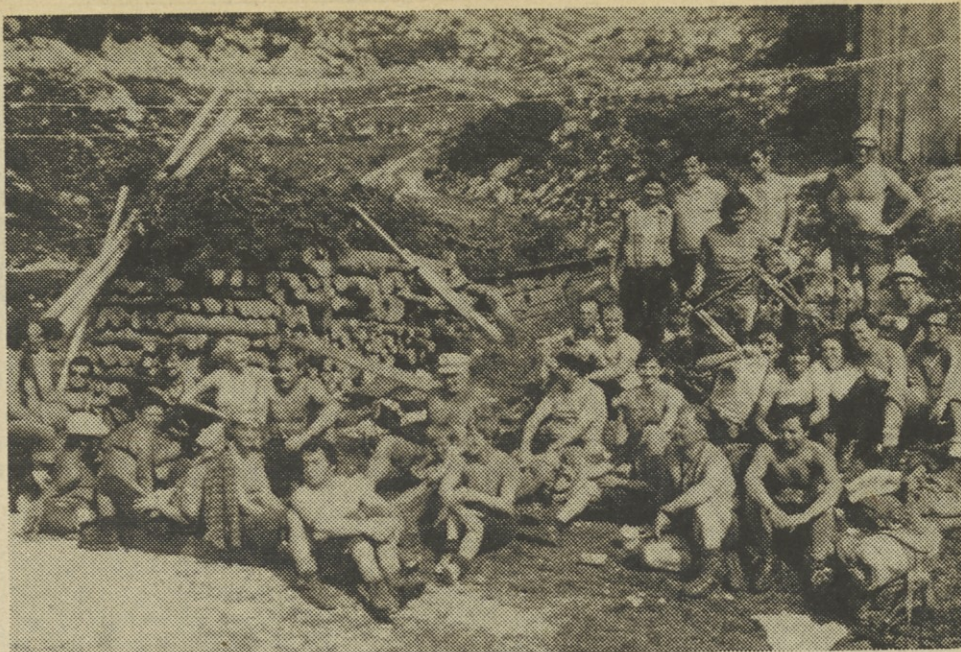
Počitek se prileže

Ko se v tem času ves kolektiv IMP pripravlja na proslavo 30-letnice obstoja z rezultati mnogih delovnih zmag, razvoja in načrtov, so se tudi planinci čutili dolžne, da po svojih močeh pripomorejo k proslavam. Glede na to, da marsikje živimo v neprimeren okolju, iščemo čist zrak daleč izven naselij, po planinah, gorah. Tam si najdemo tudi razvedrilo in nabereemo novih moči za delovne naloge, skratka, vedno bolj bomo čutili potrebo, da se vračamo