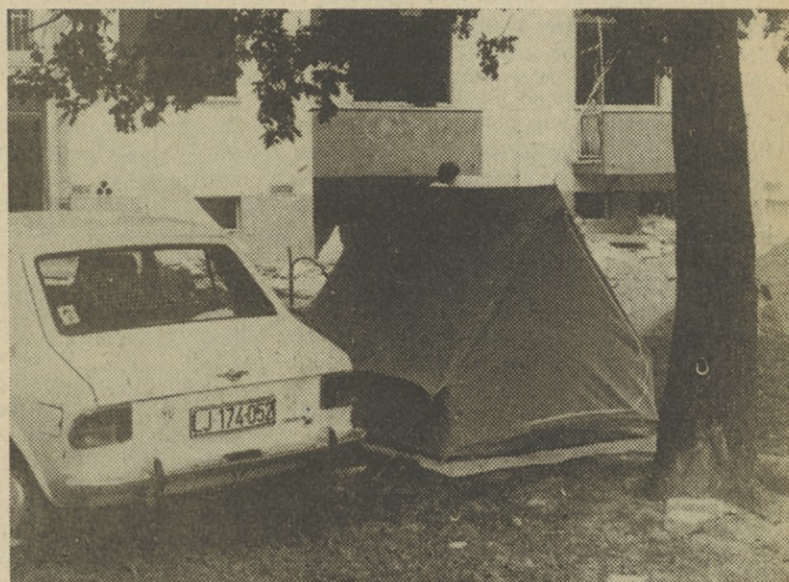
Takole sta dva naša monterja rešila stanovanjski problem v Brežicah