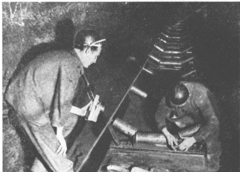
Na poli k popolni mehanizaciji našega rudnika: Montaža tekočega traku v jami