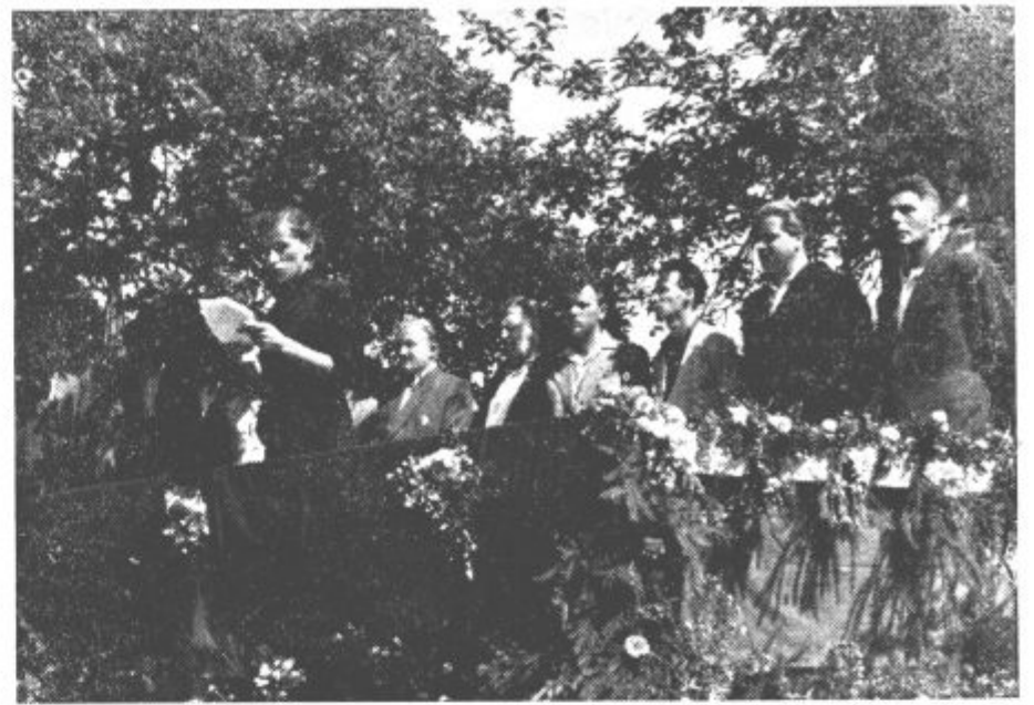
Okrajni komite ZK Soštanj ob priliki odkritja spomenika padlim mladincem na Gneču pri Mozirju.

Podružnica je sklenila, da bo v bodoče posvečala takim primerom več skrbi in pomoči, medtem ko ostalim prosilcem le v okviru možnosti. Tak človek se ne bo čutil tako osamljenega v težkih dneh svojega življenja, če bo videl, da mu je ob strani njegova delavska organizacija.