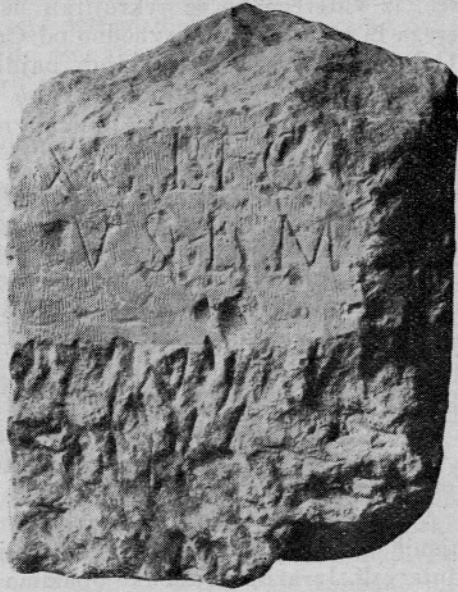
Sl. 4. Napis beneficiarija iz Čateža Bild 4. Inschrift des Benefiziars aus Čatež