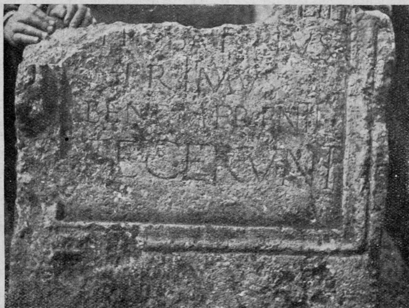
Sl. 5 a, b. Prelomljeni nagrobnik z groba 2 iz Ribnice pri Mokricah Bild 5 a, b. In zwei Teile zerbrochenes Grabmal des Grabes 2 aus Ribnica bei Mokrice