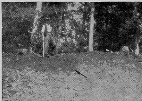
Sl. 2. Pogled na očiščen profil. Puščica kaže najdišče miljnika. Čatež pri Brežicah Bild 2. Blick auf das gereinigte Profil. Der Pfeil zeigt die Fundstätte des Meilensteines. Čatež bei Brežice

Miljnik sl. 3 in tab. I je iz rumenorjavega peščenca in močno poškodovan. Od celotnega spomenika je ohranjenih danes šest fragmentov, med