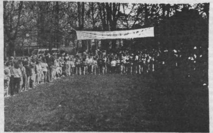
Občinskega prvenstva v krosu so se udeležili predvsem najmlajši. Na sliki start učencev drugega razreda osnovnih šol