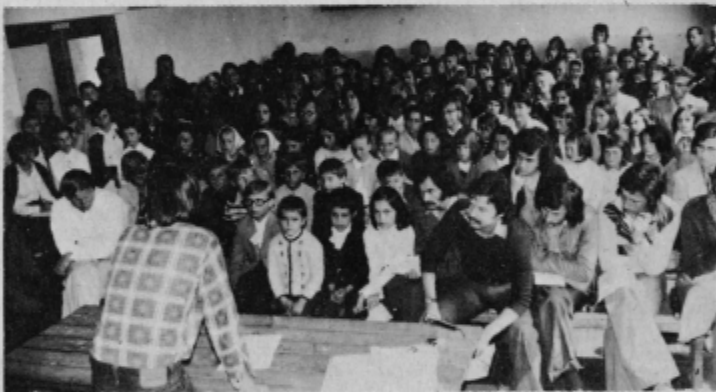
Zanimanje za preteklost Šmartna je pritegnilo v gasilski dom veliko število mladih pa tudi starejših prebivalcev iz oddaljenih krajev.