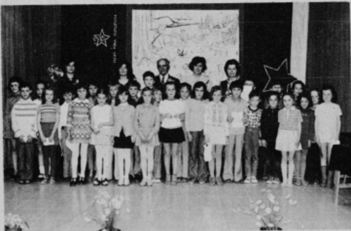
28 učencev 2. a razreda se je za zaključek fotografiralo s pisateljema Antonom Ingoličem in Vido Brest, ki sta jim na letošnji zaključni svečanosti tudi podelila bralne značke.