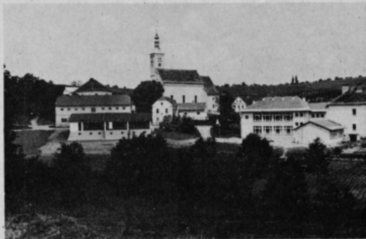
Središče Miklavža pri Ormožu z pred nekaj leti dograjeno šolo in novim vrtcem.