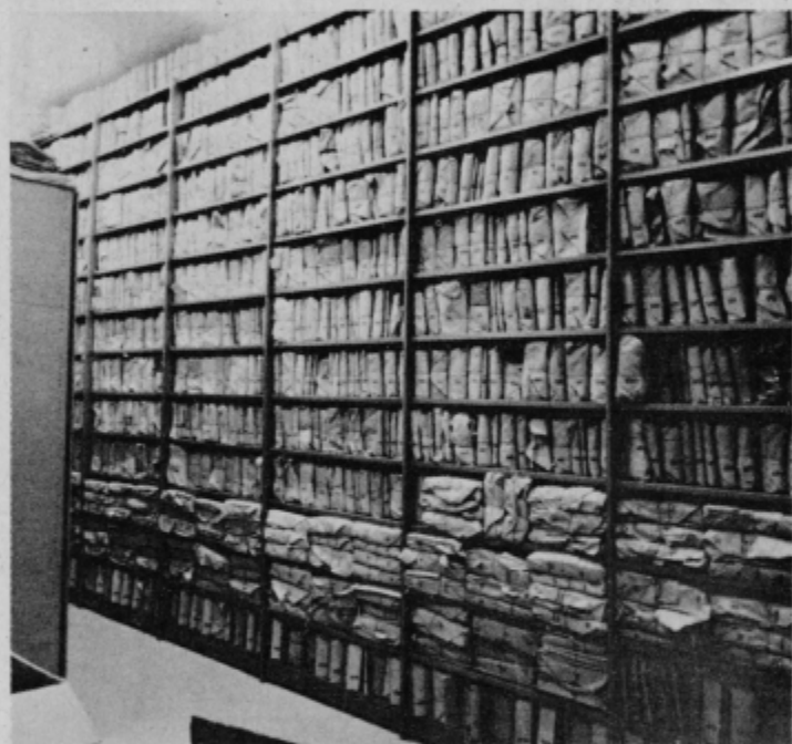
Arhivsko gradivo zloženo na police.