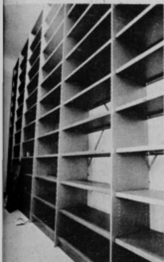
Pogled v moderno opremljeno arhivsko skladišče.