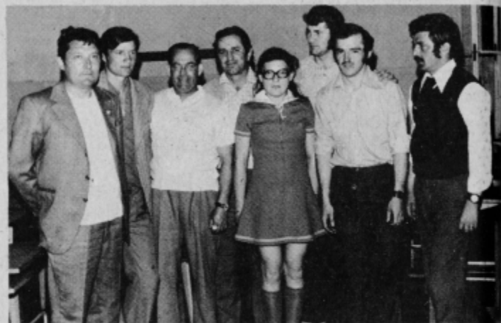
Zbiralci značk, ki so se udeležili prvega srečanja v Ptujju

Razumljivo, da so na te sestanke značkarjev vabljeni zbiralci tudi drugod, zlasti iz Ormoža, Kidričevega, Majšperka, predvsem pa mlajši, ki so značke šele pričeli zbirati. V obveščamo, da bomo v Tedniku od časa do časa objavljali novice in zvezi z zbiranjem in zamenjavo značk, obeskov in drugega. F. H.