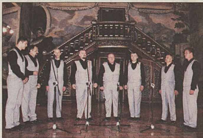
Posavski oktet v Posavskem muzeju

Posavski oktet se pospešeno pripravlja na izzid prve zgoš-