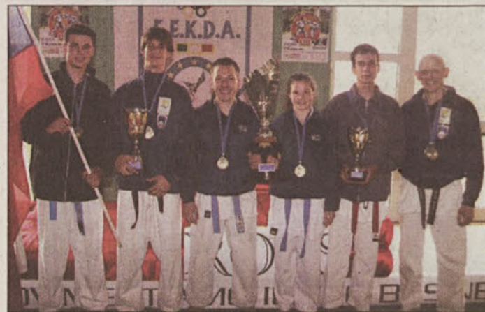
Dobitniki bronaste medalje

Na zelo napornem in zahtevnem ekipnem tekmovanju so imeli mladi "levi" v osmih krojih vsak po osem bojev. Uspeli so se prebiti celo do polfinala, kjer so zgubili proti Milanu, a so v repasažnem boju za 3. mesto prepričljivo premagali domačo ekipo Padove. Brežiški mladinci so si tako prislužili svojo prvo bronasto medaljo z evropskih tekmovanj.