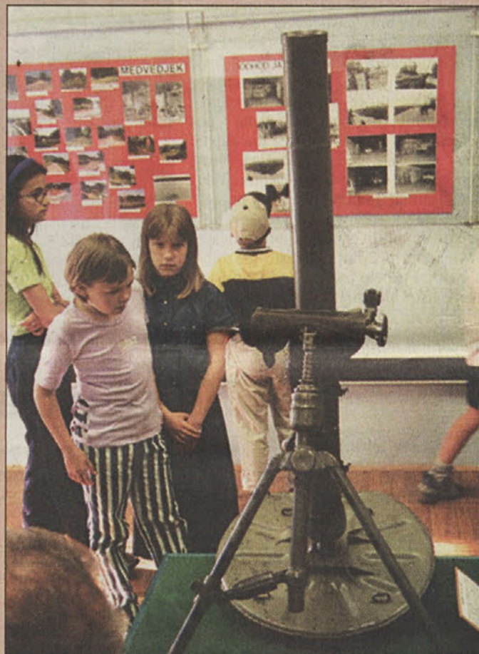
Minomet, ki je odgnal letala

K še boljšemu povezovanju Posavja pa bi lahko prispeval tudi skupni regijski časopis.