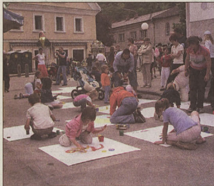
Mladi ustvarjalci pri svojem delu

Krško - Mladinski center (MC) Krško je že četrto leto zapored organiziral Mladinski kulturni festival, ki se je odvijal v starem mestnem jedru Krškega. Festival ima dva osnovna cilja, in sicer oživitve starega mestnega jedra, ki ima nepopisno zgodovinsko vrednost, drugi cilj pa je predstavitev slovenskega kulturnega ustvarjanja in hkrati priložnost, da se na odru predstavijo domači kulturni ustvarjalci. Tudi letos je bil Mladinski kulturni festival uspešen, saj je organizatorju uspelo za dva dni popestriti življenje prebivalcem mesta in ostalim, ki so se ga udeležili.