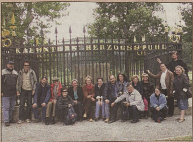
Posavski novinarji na Gosposvetskem polju