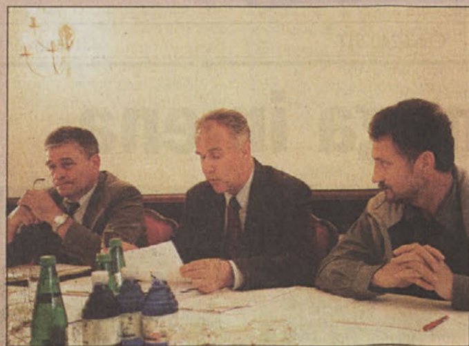
Nekdanji posavski poslanci

V minulih dneh so bile južnoslovenske občine spet na očeh širše javnosti. Vsi mediji