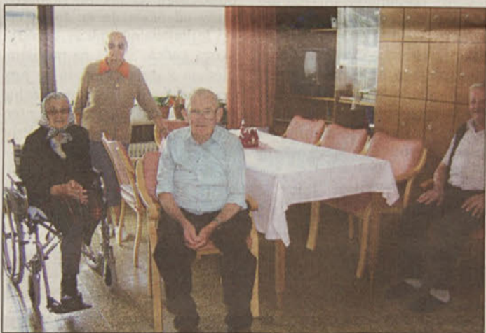
Čakajo, da bo njihov dom še lepši.

klančini, so pristali domala na glavni cesti. Ta problem bodo sedaj rešili, v naslednji fazi pa imajo v načrtu obnovo oken in vrat, kasneje še balkonov in fasade.