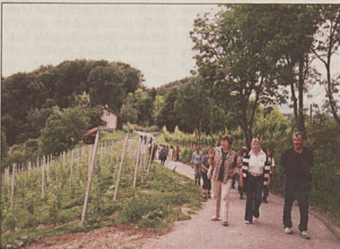
"Prvi" pohodniki na poti k repnicam