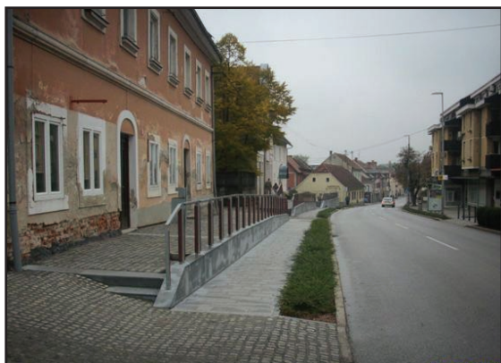
Stran 4: Nove pridobitve v občini v letu 2011