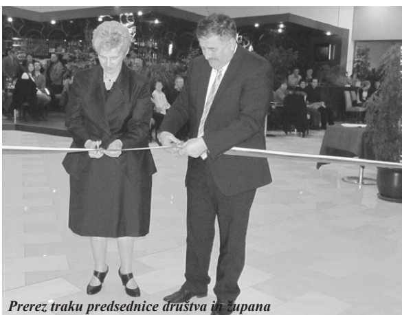
Prerez traku predsednice društva in župana

19. decembra 2009 smo se ormoški strelci preselili iz vlažne kleti v Domu društev na novo strelišče v centru Holermous. Staro strelišče je bilo ob predaji v namen v 70. letih prejšnjega stoletja, eno najmodernejših v bližnji in daljni okolici in tudi eno prvih, ki je bilo opremljeno z električnimi nosilci tarč. Takratno strelišče je pomenilo velik zagon in prvi večji preskok v kvaliteti športnega strelstva v Ormožu. Vendar ga je prerasel čas. Vlaga nam je uničevala opremo in orožje, vsako obilnejše deževje je povzročilo vdor vode na strelišče.