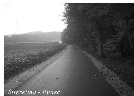
Strezetina - Runeč