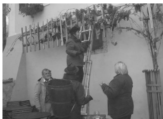
Skrbnica trte s pomočniki