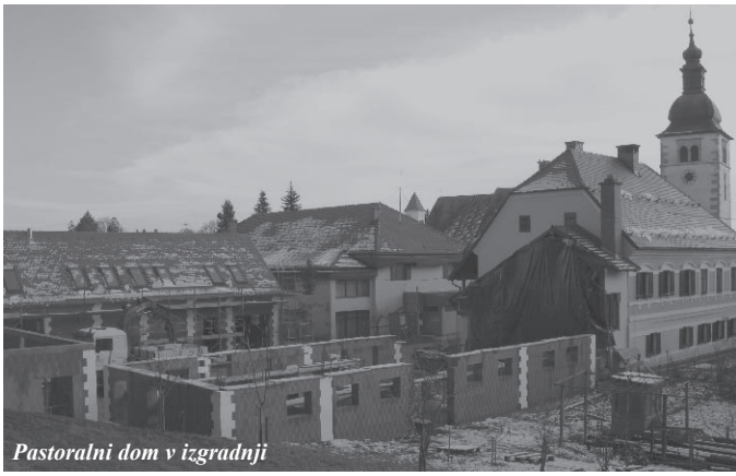
Pastoralni dom v izgradnji