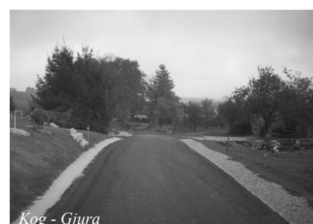
Kog - Gjura