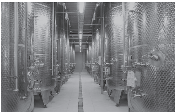
Nova fermentacijska hala

koristili tudi za prednovoletno srečanje s poslovnimi partnerji, ki se je nadaljevalo na Dvorcu Jeruzalem. Tam so predbožične praznike zaznamovali še s prižigom več kot 3000 lučk na posebni novoletni jelki, v obliki »steklenice«, ki bo vse do sredine januarja krasila prepoznavno lokacijo sredi jeruzalemskih vinogradov.