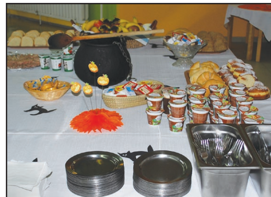
Stran 15 in 16: Zanimivo na šolah