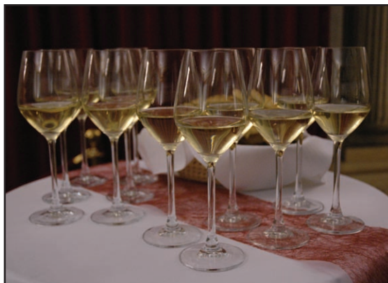
Stran 8 in 9: Martinovanje 2011