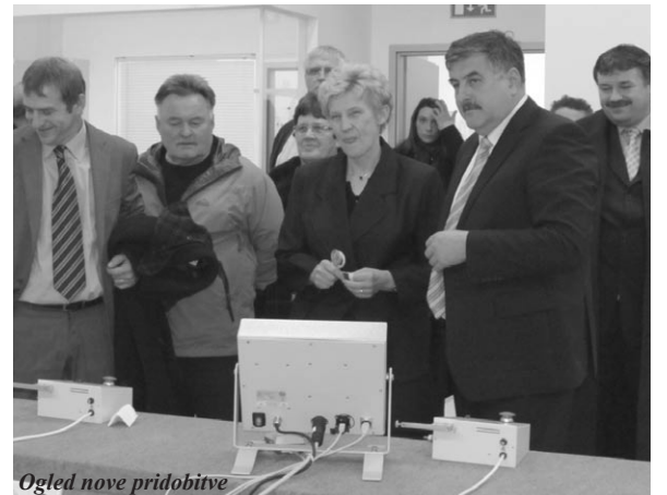
Ogled nove pridobitve