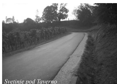
Svetinje pod Taverno