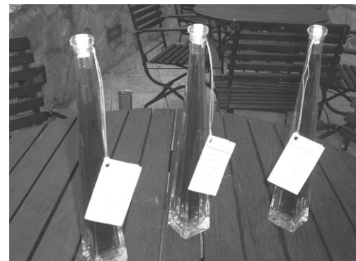
Steklenice lanskega letnika. Teh je bilo 100.