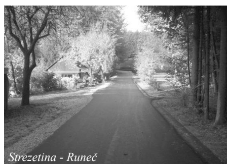
Strezetina - Runeč