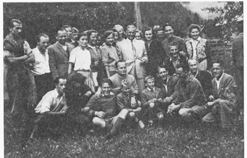
S koroškimi planinci v Logarski dolini leta 1953

29. 11. 1943 je bilo v Jajcu 2. zasedanje AVNOJ. Na osnovi