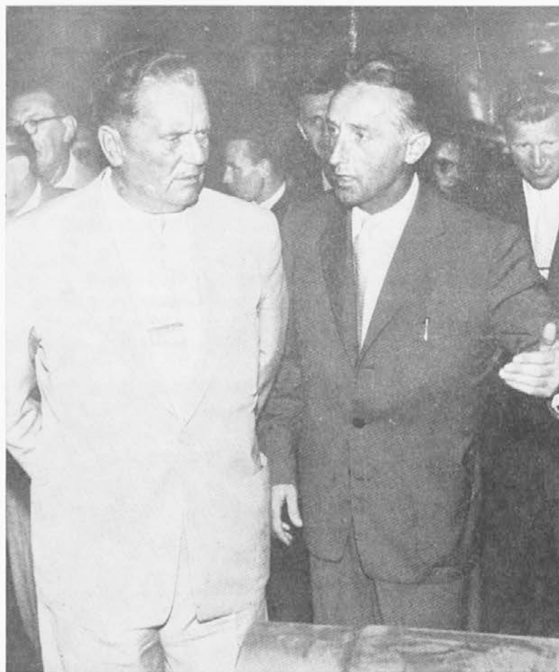
Spoznavanje naših jekel