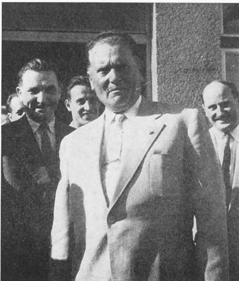
Sprejem pred Domom železarjev leta 1958

Zato je Jugoslavija država, v kateri ne danes ne kadarkoli niso potrebni nobeni izjemni ukrepi, saj smo Jugoslovani mobilizirani po Titovem geslu izpred nekaj desetletij: