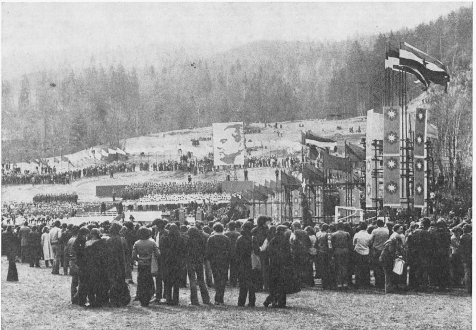
Prizor, na katerega bomo zmeraj ponosni