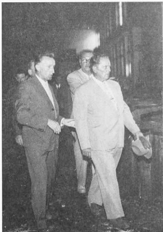
Pozorna pot po obratih

»Zelo me je presenetila vest, da bo Ravne obiskal naš dragi Maršal. Prejeli smo jo nekaj ur pred njegovim prihodom. Vznesirjenost in radost pa sta se še veliko bolj povečali z odločitvijo, da mu v imenu občanov in železarjev izrečem našo dobrodoščilo ter pozdrav. Predvsem mi je ostal v spominu pogovor v vrtu Doma železarjev, Titova neposrednost in konkretna vprašanja, na katera smo morali odgovorjati kratko in jedrnat, saj je takoj dal vedeti, da ne mara dolgih, okrašenih odgovorov. Predvsem se je zanimal za naš razvoj, pogoje dela in plače delavcev tako v metalur-