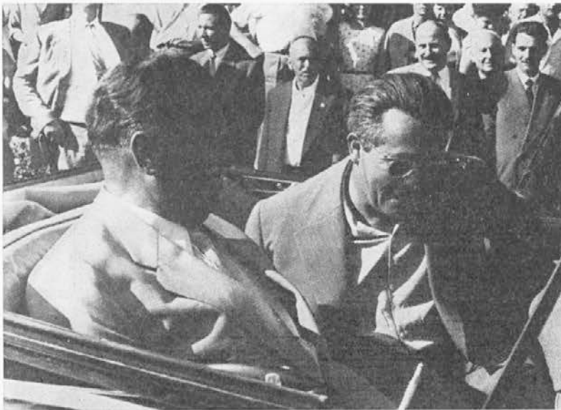
Tito in Kardelj — tvorca naše revolucije

1970 — 9. decembra 1970 je bil Tito na osnovi ustavnih pooblastil kot predsednik republike pobudnik pomembnih politično ustavnih sprememb, ki so bile najprej zajete v ustavnih