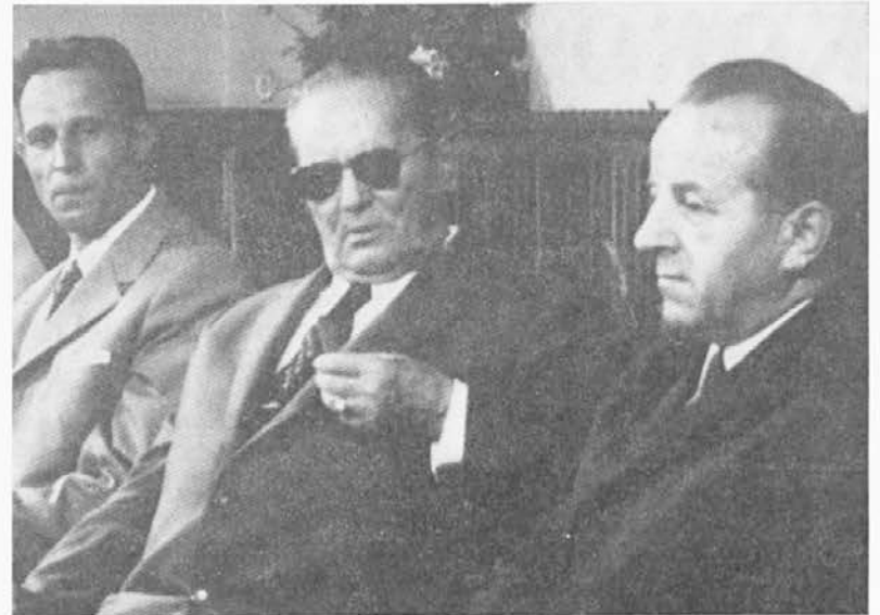
Pogovor z delavci

»Duh tehnokratizma ni samo v tovarnah pri vodilnih, temveč prihaja na površje zunaj podjetja, v nekaterih družbenopolitičnih organizacijah. Zato je potrebna kontrola delavcev in