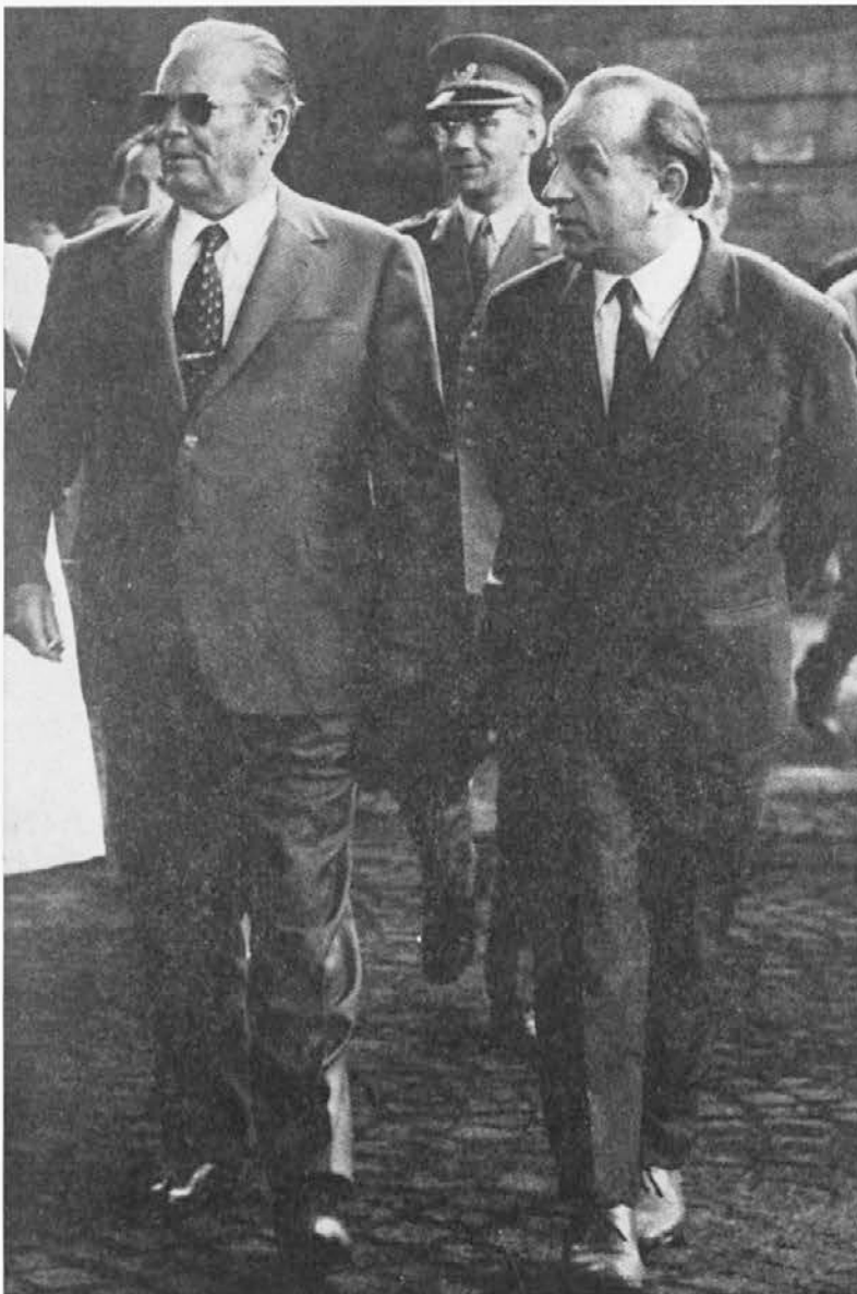
S ponosom smo pokazali predsedniku moderno železarno

»Takrat sem v Domu železarjev vodil razgovor in moram reči, da mi je bilo v začetku nekoliko tesno pri srcu zaradi bojazni, da se ne bi najbolje odrezal, a me je ta trema kaj hitro minila. Tako življenjsko, preprosto, konkretno in neposredno vpraševati kakor tudi odgovarjati, skratka, res tovariško se pogovarjati je pravi užitek. V takem pogovoru ni treme in zadržanosti, tako se pogovarja tovariš Tito. Zanimal se je za vse. Kar je želel izvedeti, je vprašal naravnost in tako je tudi odgovarjal ter posredoval svoje misli. Vsako ovinkarjenje in kompliciranje mu je bilo tuje. Rad pa se je tudi pošalil. Prav zaradi vsega tega mi bo Titov obisk ostal za zmeraj v spominu kot eden najlepših trenutkov v mojem življenju.«