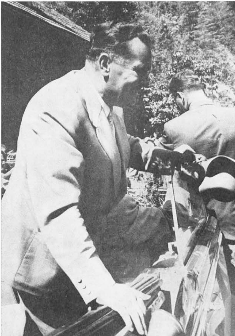
Veder in nasmejan spomin

Ovo nam je naša borba dala, da imamo Tita za maršala.