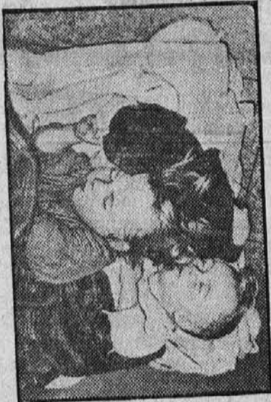
Dva mala poplavljenca, ki sta zaspala kar na trdih tleh na železniški postaji v Memphis, Tenn.