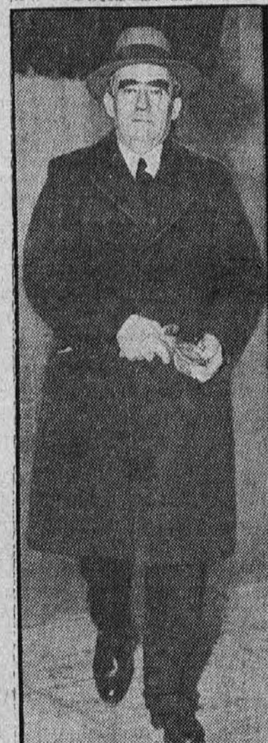
Admiral Cary T. Grayson, načelnik ameriškega Rdečega križa, ki je v zadnji poslavi storil skoro nečloveško delo, da je nudil hitro pomoč poplavljenem.