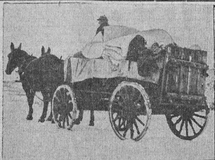
Tisoče ljudi je moralo bežati pred zadnjo poplavo. Naložili so v naglici na vozove, kar so mogli, ter bežali v višje kraje.