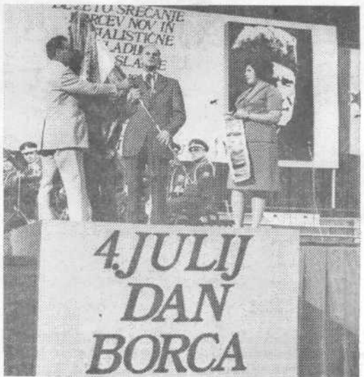
3. julija je bila v dvorani Tivoli svečana akademija, ki so se je udeležili tudi gostje — udeleženci srečanja borcev in mladine