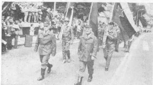
Korak pripadnikov enot civilne zaščite je bil strumen...