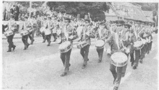
Kadeti-bobnarji so tudi tokrat navdušili gledalce