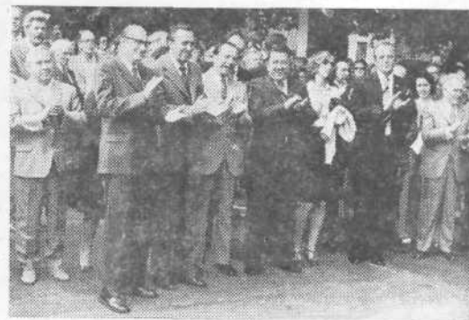
Prisrčno srečanje za »Dan Rečanov« je bilo letos v Ljubljani in kot vedno zelo prisrčno