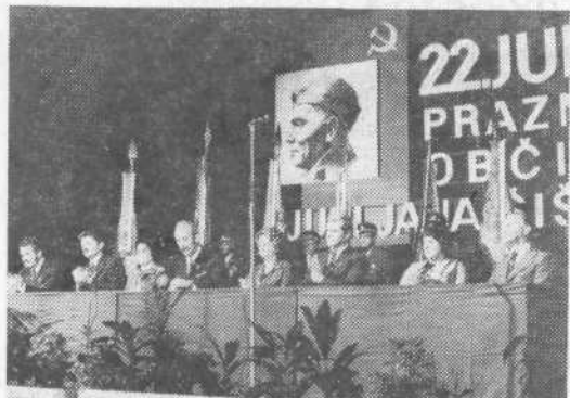
Po končani povorki je bila v dvorani Tivoli slavnostna seja občinske skupščine, na kateri so podelili domicil Rašiški četi in Dolomitskemu odredu ter podelili priznanja občine Šiška. Sledil je bogat kulturni program