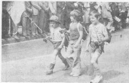
Mala ribiča sicer nisti imela »dokazov« s seboj, toda zatrčila sta nam, da znata palici dobro uporabljati...