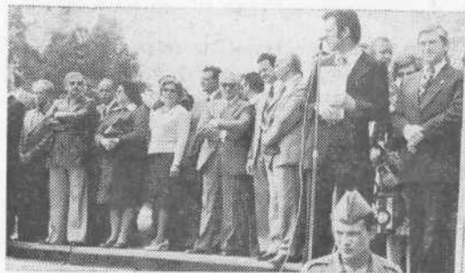
Na tribuni, ki so jo postavili pod dvorano Tivoli, so se zbrali številni gostje