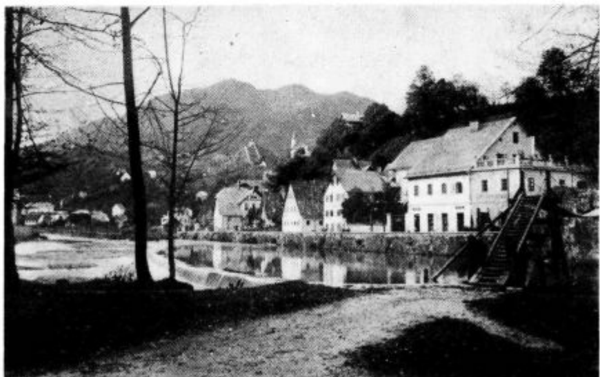
Gladina vode in »cigu« most pri Debeli skali. Posnetek iz leta 1916