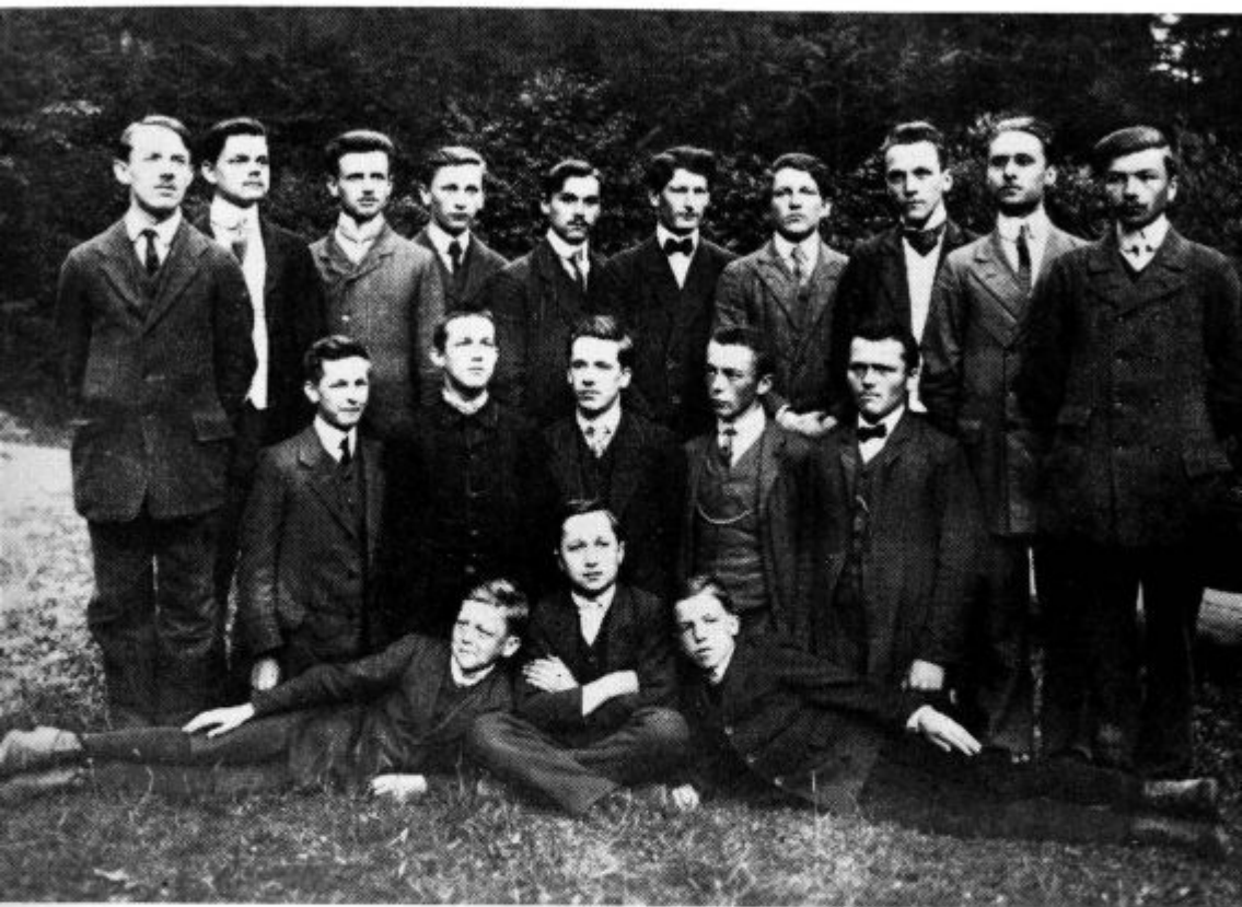
Skupina dijakov narodnoradikalcev leta 1912/13