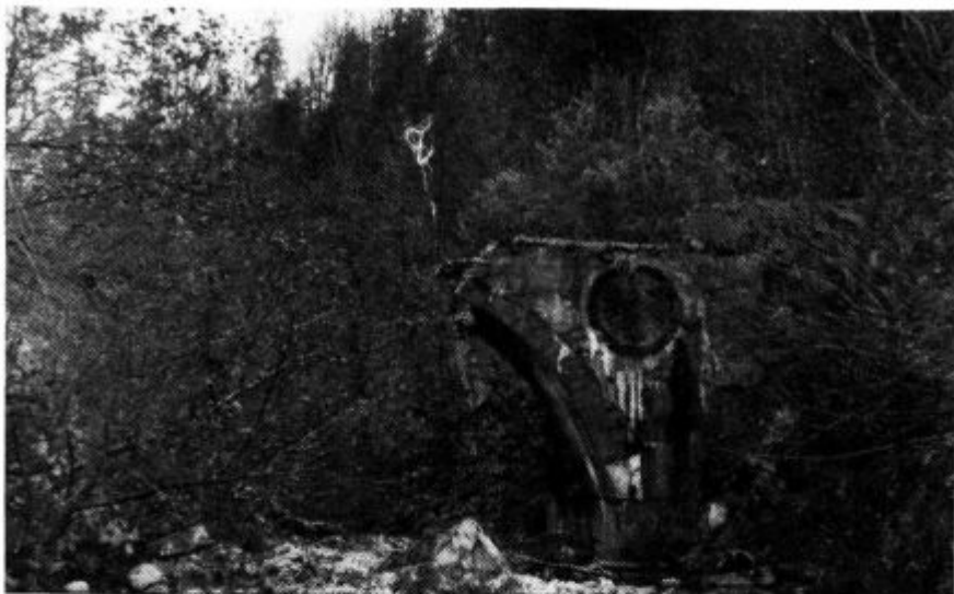
Ostanki porušenega mostu