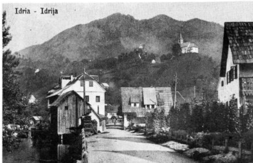
Stara cesta in hiše pod gorami