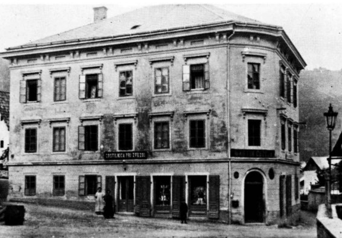
Deželova hiša okrog leta 1900. V prvem nadstropju na zadnji strani proti sedanji Rožni ulici so bili prostori DBD in dijaških organizacij.