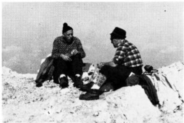
Na Kaninu 30. julija 1968.