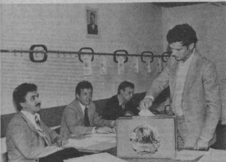
Tri četrtine krajanov Črnuč je odločilo: