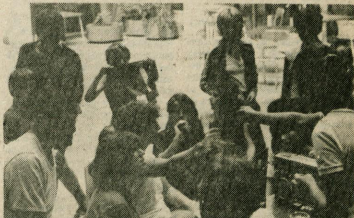
Igre, razvedrilo, rekreativne dejavnosti . . . Mladi Domžalčani na letovanju v Kopru

Ob razmišljanju o tem načelu, smo člani predsedstva pri ZPM Domžale že v mesecu decembru začeli razpravljati o pripravah na letovanje otrok in mladine.