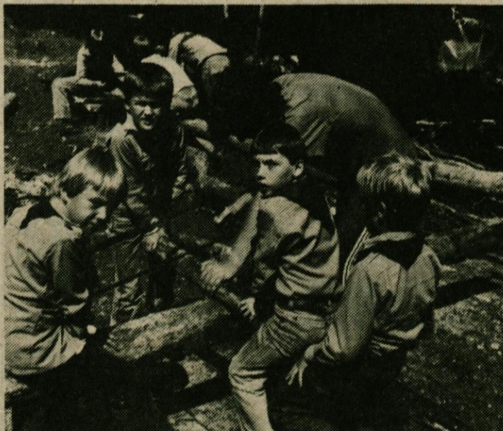
Domžalski taborniki v Bohinju

Bohinj je le eden, če ga omenjamo v zvezi s taborništvom, pa to še toliko bolj drži. Kot že vrsto let doslej, smo tudi letos taborniki domžalske občine postavili svoje platnene domove ob prelepem Bohinjskem jezeru. Letos je bil vhod v tabor nekoliko drugačen. Ob emblemu odreda skalnih taborov iz Domžal sta se pojavila še dva nova: odred Upornega plamena iz Mengša in Mlinskih kamnov iz Radomelj. Kot organizator taborenja prvič nastopa Zveza tabornikov občine Domžale.