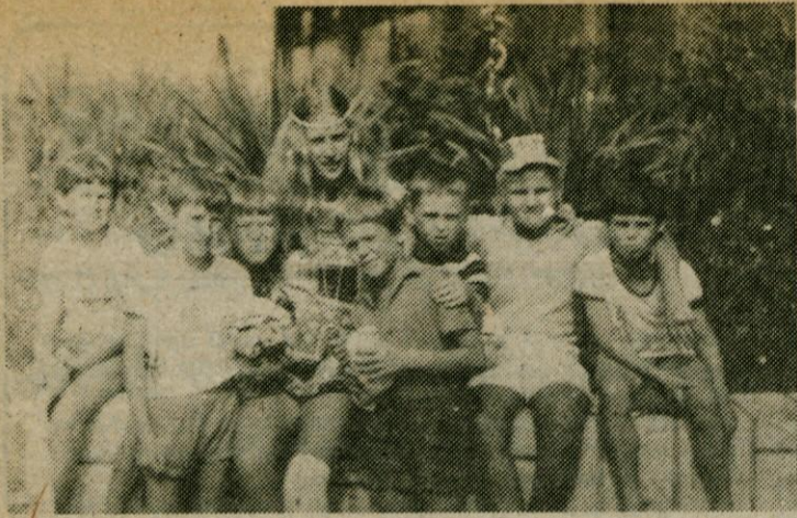
Tovarišica in njeni varovanci