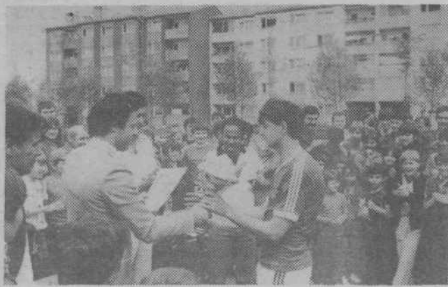
Prehodni pokal na turnirju v malem nogometu je zaslužen osvojila ekipa Sing-Sing (na sliki), v košarki pa ekipa Bratov Tuma.