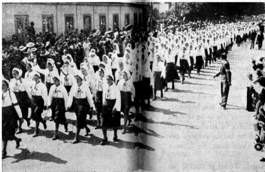
Članice dekliških krožkov v sprevedu.

Dobro vemo, da more priti do takega mladinskega praznika v tako kratkem času le, ako mladino dviga iskreno navdušenje in brezmejna požrtvovalnost v zavesti visokih ciljev, ki jo vodijo pri njenem delu. Ko se vam ob tej priliki s sestersko iskrenostjo zahvaljujemo za veličastno delo, h kateremu ste pripomogle v toliki meri tudi ve s svojim delom pri tekmah, v sprevedu in pri telovadnem nastopu, vemo, da so naše besede revne v primeri z bogastvom, ki ste ga prinesle v Ljubljano in ga delile