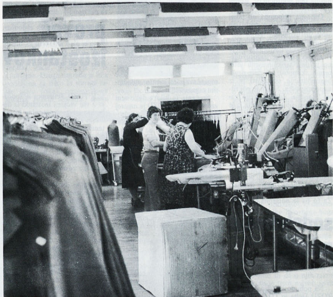
V TOZD Temenica so si zadali nalogo zmanjšati odsotnost iz dela. Velik korak v tej akciji pa je bil storjen z organizacijo pogovora zdravstvenih delavcev s predstavniki temeljne organizacije in delovne organizacije Labod.