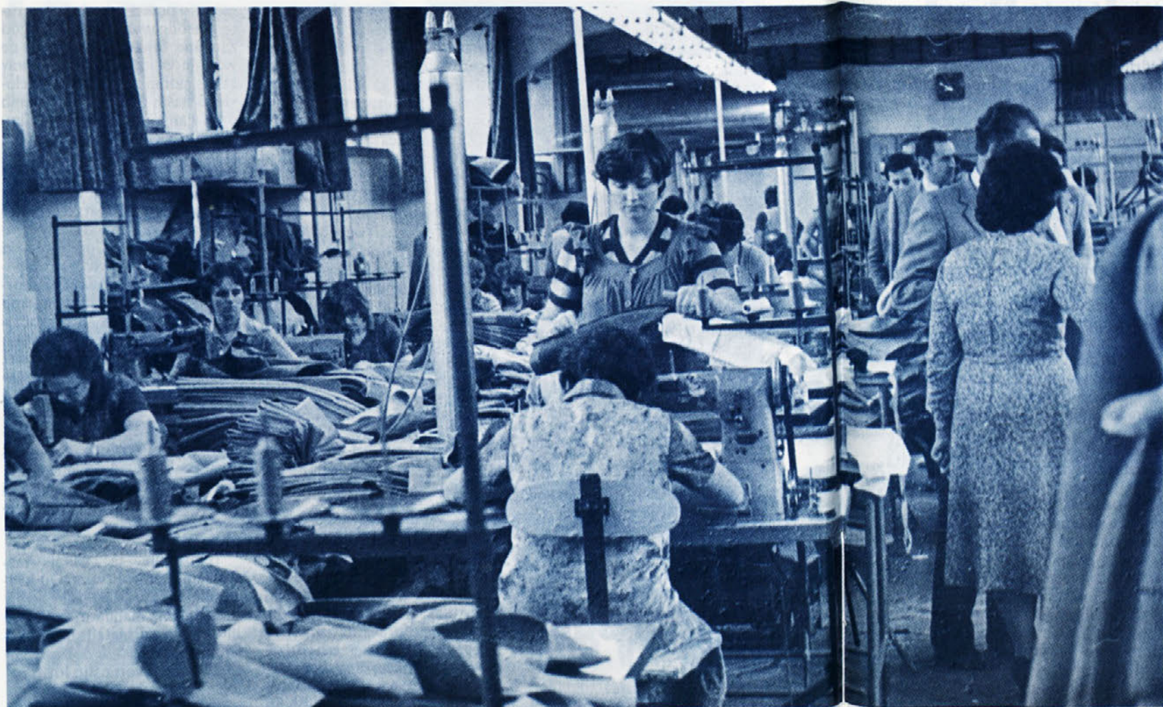
Vse pogosteje prihajamo tudi v Zalo. Posnetek je iz zadnjega delavskega sveta delovne organizacije, pred nedavnimi so ta kolektiv obiskali tudi delavci DSSS na svojem „sindikalnem izletu“ po idrijskem delu Slovenije.

Delegacijo TOZD Elektrokovinar Ptuj so sestavljali: