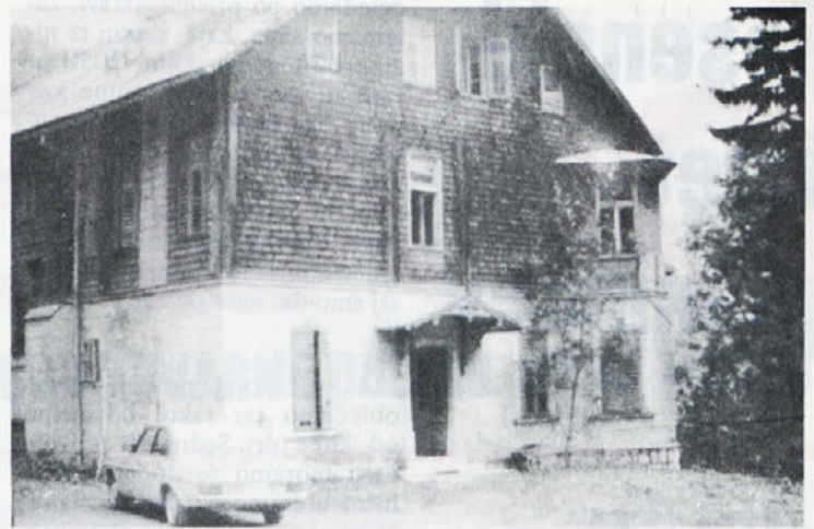
Adaptacijska dela v domu na Zelenici so že stekla. Dom bo že letošnjo zimo sprejel svoje goste.

Če se še niste odločili za nakup, vam priporočamo, da poiščene poverjenika Prešernove družbe in zbirko pri njemu naročite. Lahko pa izpolnite tudi priloženo naročilnico in jo pošljete naravnost Prešernovi družbi, Ljubljana, Borsetova 27.