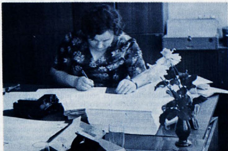
Posnetek iz računovodstva TOZD TIP-TOP, kjer je vedno dovolj dela, ob periodičnih obračunih pa še toliko več.

Zvezna statistika je pred dnevi objavila enajstmesečne podatke lanskih osebnih dohodkov zaposlenih v družbenem sektorju. V Sloveniji so znašali povprečno 8636 dinarjev, na Hrvaškem 7858 din, v ožji Srbiji 6947 din, v Vojvodini 6925 din, v Bosni in Hercegovini 6574 din, v Črni gori 6531 din, v Makedoniji 5996 din in na Kosovu 5826 din.