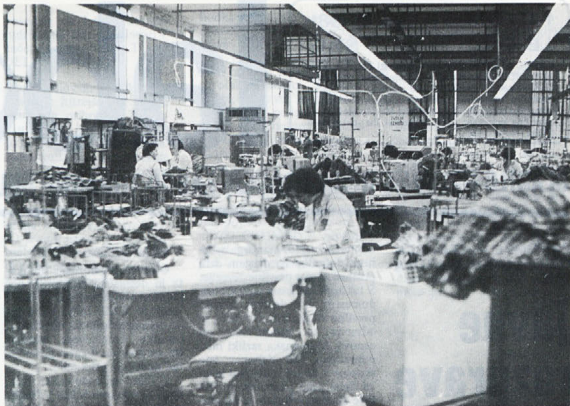
Pogled v proizvodnjo TOZD Libna

V Labodu v Novem mestu je bila 20. oktobra organizirana razprava o osnutku zakona o razširjeni reprodukciji in minulem delu. Razpravo je organiziral občinski sindikalni svet skupaj z republiškimi sindikalnim svetom ter osnovnimi organizacijami sindikata TOZD Ločna, Commerce in DSSS.