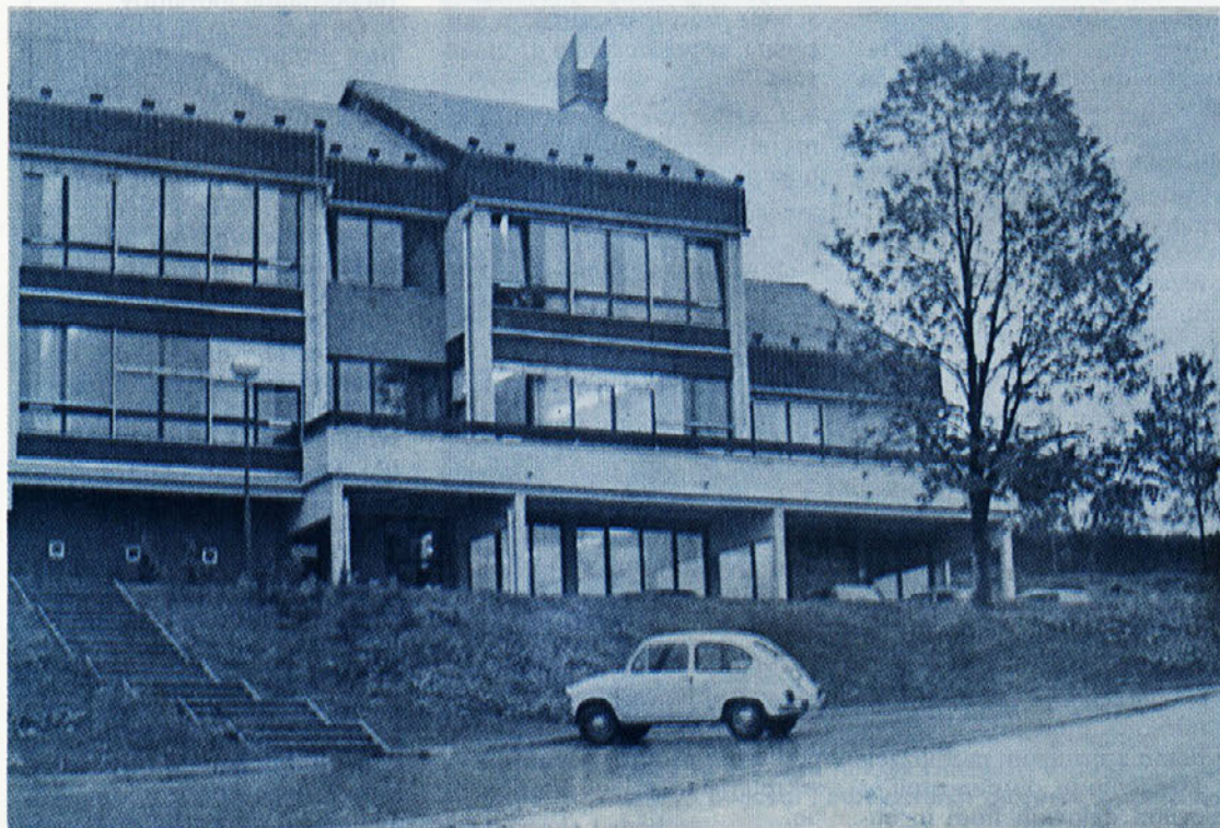
Ob prazniku občine Novo mesto, 29. oktobru, je bil odprt vrtec v Ločni, za katerega je odstopila zemljišče TOZD Ločna. V novem vrtcu je našlo mesto tudi 31 otrok Labodovih delavk.