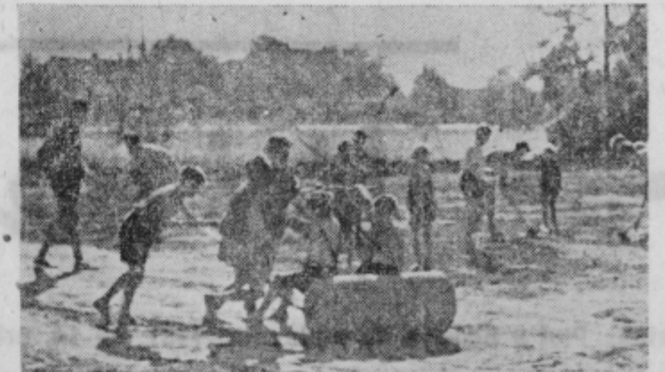
Breški otroci pri delu z majhnim valjarjem

Med kmeti v Frankovcih so posamezniki, ki pa namesto očiščenja jarkov in propustov pridno »čistijo« meje, jarke in poljske poti, hoteč si prigrabitih sedovno zemljo. Tega primera seveda ne navajamo zato, da bi ga komu postavljali za zgled. Prav tako pa tudi tistega kmečkega pastirja iz Obreža ne, ki po navodilih svojega dedka po tujem pase živino, hodi v tuje sadovnjake po sadje ter se še nespodobno izraža, če ga kdo na te prestopke opozori. Malenkosti — bi lahko kdo dejal. Toda nekje se stvari začnejo, FI