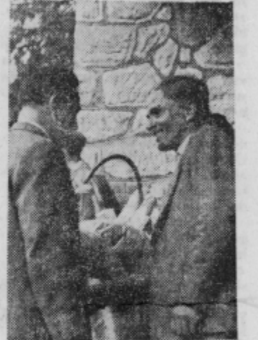
Tov. Vogrinca so obiskali v zdravilišču na Pohorju mestni uslužbenci

Naše mesto so poljski študentje zapustili presenečeni nad gostoljubnostjo naših ljudi, ki so jim priskrbeli kosilo. RM