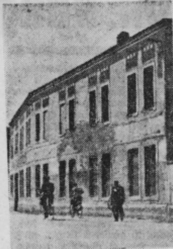
Bivša Tamova hiša v sedanjem stanju

umakniti majhnemu parku. Iz te moke ni bilo kruha, ker je razvoj Ptuj za novim mostom pokazal odgovornim ljudem novo rešitev — adaptacijo bivše Ta-