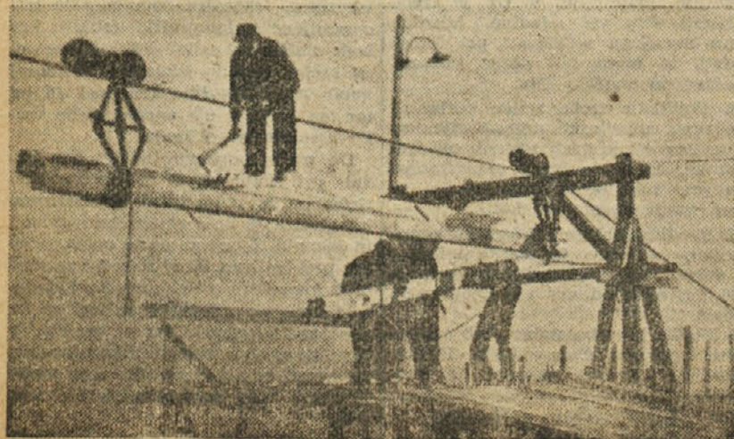
Les se sedaj dovaja potom žičnica