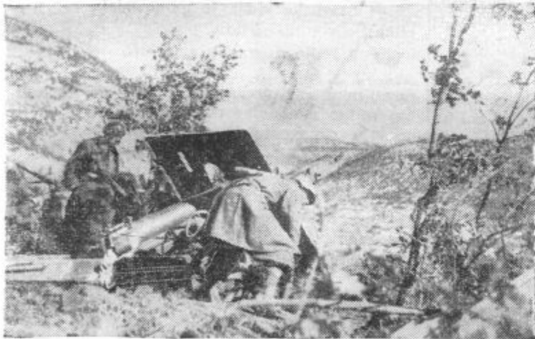
Na albanskih frontah igra danes zelo važno vlogo artilerija, tako pri ofenzivnih sunkih kakor tudi pri ofenzivnih sunkih kakor tudi strelkov je v skalnatih pečinah in na kamenitem terenu neprimerno večji od mehke zemlje. Vsled tega se sovražnika poslužujeta v obilni meri artilerije, ki po cele dneve neprestano grmi v skalnati Albaniji. Na sliki vidimo top v albanskih gorah.

Nemčija seveda mora nositi glavno težo napada. Njeno načelo, udariti na Anglijo, kjerkoli jo sreča, ji nalaga občutno delitev sil. Bodočnost bo pokazala, ali so Nemci v Rumuniji samo zaradi zavarovanja petrolejskih vrelcev ali imajo še druge in morda celo važnejše naloge in namene.