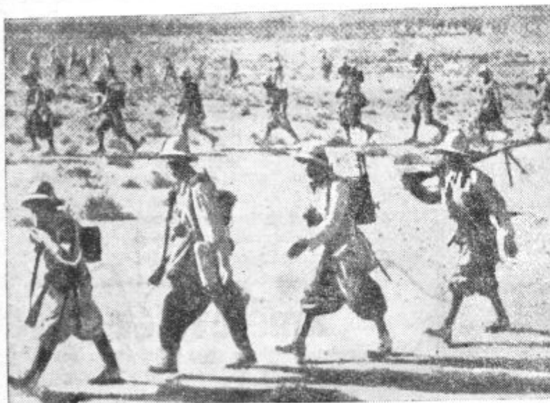
Italijanski vojak! v Libiji hite na pomoč ogroženim postojankam. Vsaka vojska v Afriki se najbolj muči z vprašanjem pitne vode. Pomanjkanje pitne vode je najhujši sovražnik vsake manevrske vojne v Afriki

Na japonsko posredovanje se je položaj med Siamom in Indokino precej izboljšal. Francoska vlada je na japonske posredovalne predloge in zahteve odgovorila v tako spravljenem duhu, da ni računati z obnovitvijo sovražnosti med Indokino in Siamom, pač pa bodo nadaljevali pogajanja za sklenitev dokončnega miru.