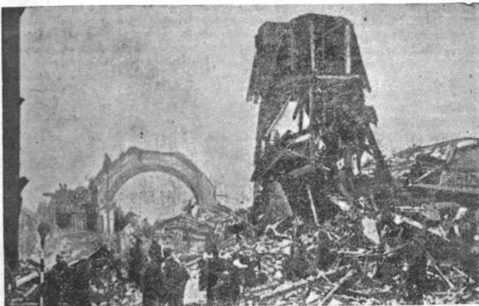
Razdejana angleška plinarna, na katero so odvrgli nemški strmoglavci težke rušilne bombe

■ Med azijskim polotokom Sahalinom in Moskvo je bila pred nedavnim vzpostavljena direktna telefonska zveza.