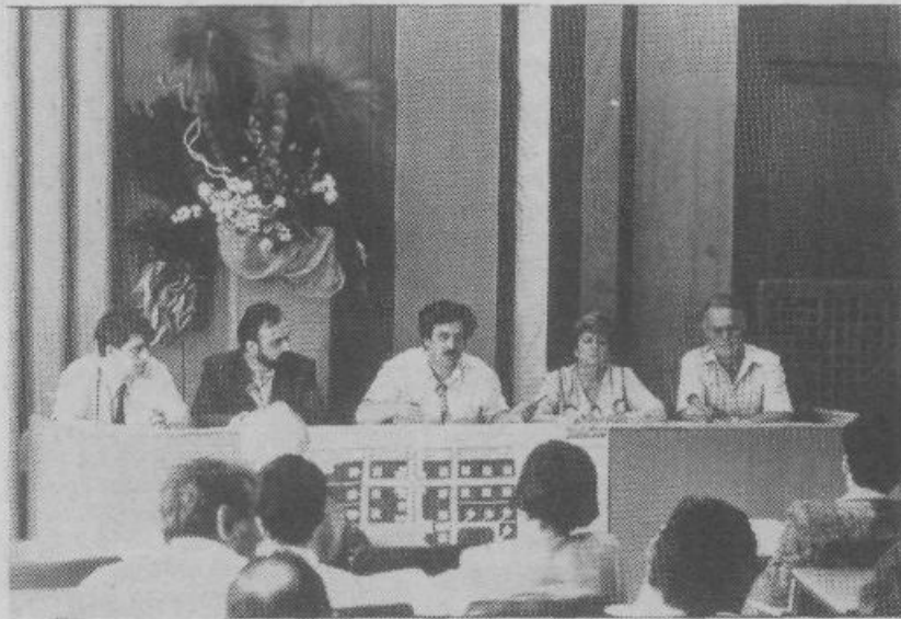
Z zasedanja zborov občinske skupščine