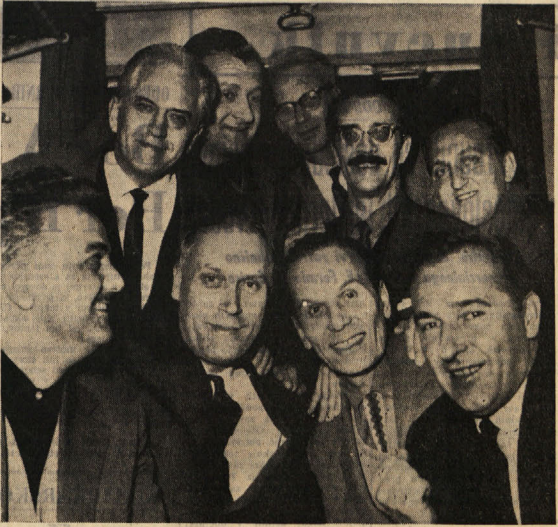
Slovenski oktet, ki se 8. nov. spomnil svojega zvestega tržaškega občinstva s pozdravi iz ZDA, kjer je bil na veliki turneji, nas bo prihodnji torek kar osebno obiskal. Oketovci bodo priredili v Auditoriju koncert izbranih del domačih in tujih skladateljev. (Na sliki Slovenski oktet na poti skozi Trst, ko se je pred dnevi vračal iz ZDA in Kanade)

drugi strani, poleg teh pa še nekateri zagrizeni unionisti. In vendar, navzlic tej heterogenosti, se je našla možnost za sestavo nove vlade, vtem ko pa svet revolucije ni mogel biti sestavljen. Prvotno je bilo mišljeno, da bi ta bil sestavljen od izključno vojaških elementov, kasneje se je mislilo na kombinacijo vojaških in političnih predstavnikov. Toda, ko je bilo treba listo sestaviti, so si mnogi mislili, da bi ta bila sestavljena od izključno vojaških in političnih predstavnikov. Toda, ko je bilo treba listo sestaviti, so si mnogi mislili, da bi ta bila sestavljena od izključno vojaških in političnih predstavnikov. Toda, ko je bilo treba listo sestaviti, so si mnogi mislili, da bi ta bila sestavljena od izključno vojaških in političnih predstavnikov.