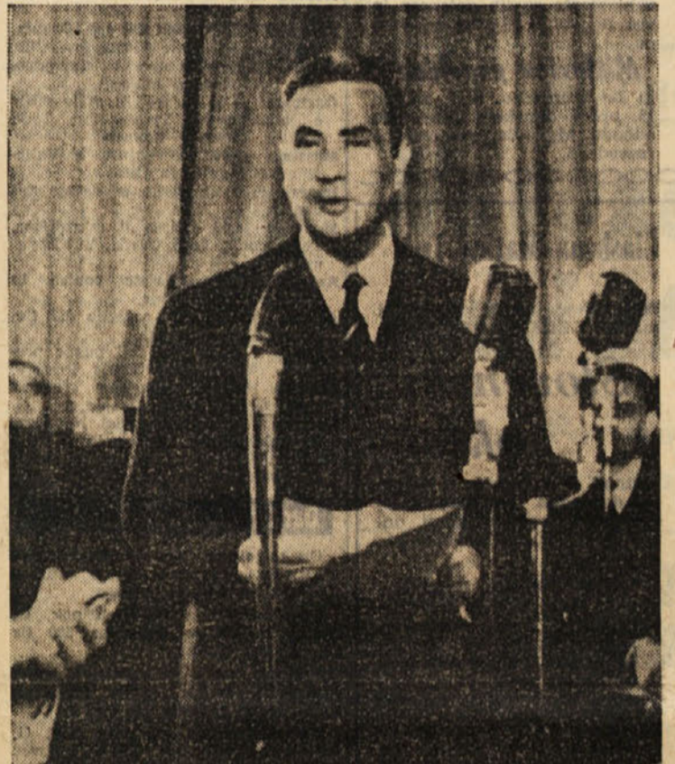
Moro bere časnikarjem seznam ministrov

te pretežne večine delavcev. «Osebo bi bil vsekakor rajše ostal v vodstvu PSI, ki sem jo vodil skoraj nepretrgano skozi 40 let. Stranka pa je odločila drugače. Menjam delovno sobo, toda delam še nadalje za isto stvar in za edine koristi, ki jih poznam, in s katerimi se istovestim: za koristi delovnega ljudstva in njegovega demokratičnega vzpona, da postane vodilni razred družbe in države».