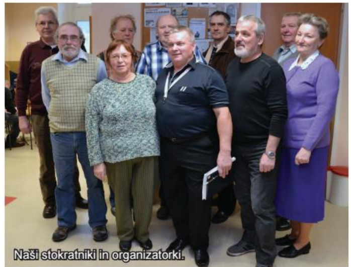
Naši stokratniki in organizatorki.

obsegu zaznati. Vendar je to včasih nemogoče, saj jo nekateri zaradi sramu dobro prikrivajo.