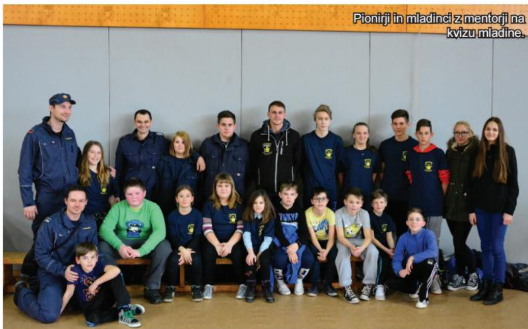
Pionirji in mladinci z mentorji na kvizu mladine.

Kot dober gospodar svojih prostorov smo PDG Apače uredili oz. dokončali mansardo v gasilskem domu, kar pomeni, da smo nabavili pohištvo in tako pridobili površine za sestanke, druženje članov predvsem pa površine za delo z mladimi. Društvo je tudi kot gospodar doma krajanov Apače sodelovalo pri obnovi, in kot je bilo opaziti, je dom v povsem novi, modernejši luči, za kar gre zahvala predvsem krajevnemu odboru, članom PGD Apače, našim vaščanom za opravljeno prostovoljno delo ter Občini Kidričevo, ki je poskrbela za financiranje projekta. Bili smo aktivni tudi na področju kulture, saj smo v letu 2015 organizirali dve predstavi s Tadejem Tošem v občinski dvorani Kidričevo, kjer ni manjkalo dobre volje in nasmejanih gledalcev. V letu 2016 je eden pomembnejših ciljev delo z