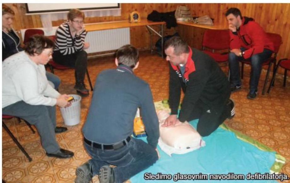
Sledimo glasovnim navodilom defibrilatorja.

Avtomatski zunanji defibrilator (AED) je laični medicinski aparat, ki glasovno vodi in usmerja postopke ter po potrebi ob zaznavi zastoja srca zahteva električni sunek. Ta steče skozi srce in lahko ponovno vzpostavi njegovo delovanje. V času, ko smo pričeli množičneje uporabljati AED, se je smrtnost zaradi zastoja srca precej zmanjšala.