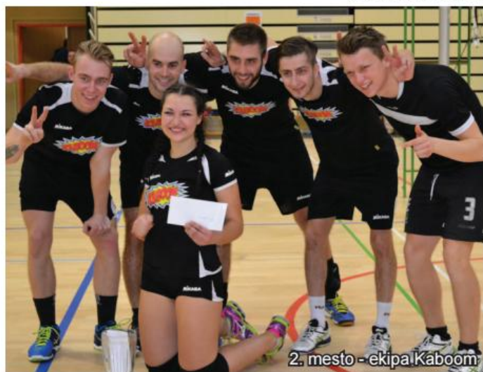
2. mesto - ekipa Kaboom