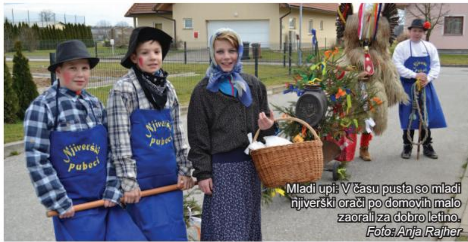
Mladi upi: V času pusta so mladi njiverški orači po domovih malo zaorali za dobro letino.

Etnografsko društvo Kurenti Vetrovniki Kidričevo