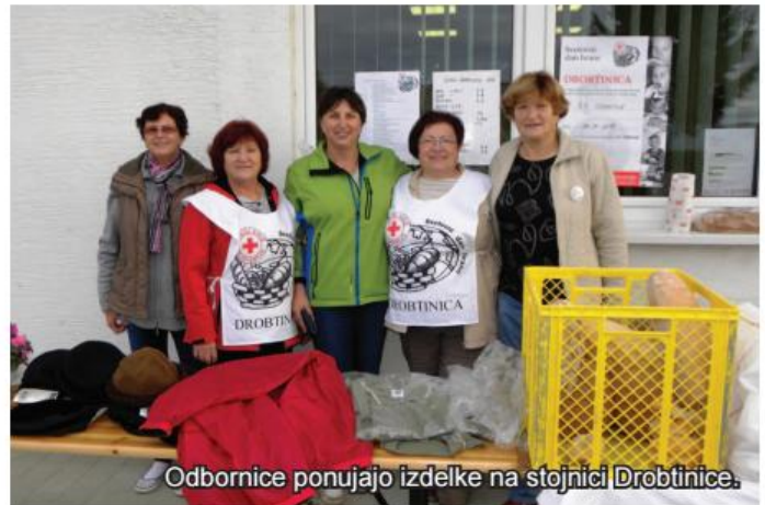
Odbornice ponujajo izdelke na stojnici Drobotnice.