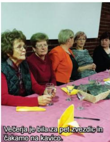
Večerja je bila za pet zvezdic in čakamo na kavico.

Osteoporozo in inkontinenca urina so pogoste nadloge tako moških kot žensk. Opažamo že pojavnost pri vedno mlajši populaciji. Zelo pogosto je to zamolčana težava, posebno inkontinenca pri moških. Nastanek težav lahko preprečimo, jih premaknemo na kasnejše starostno obdobje ali pa jih omilimo s pravilnimi preventivnimi vajami.