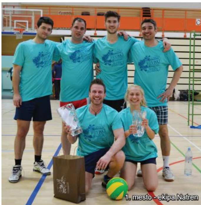
1. mesto - ekipa Natren

V soboto, 27. 2. 2016, se je v organizaciji ŠD Šikole v dvorani v Cirkovcah odvil že 7 turnir v odbojki. Letos smo ponovno dokazali, da smo sposobni organizirati kvaliteten rekreativni turnir, odmevnost turnirjev prejšnjih let pa je pripomogla k prijavljanju zelo oddaljenih ekip iz celotne Slovenije.