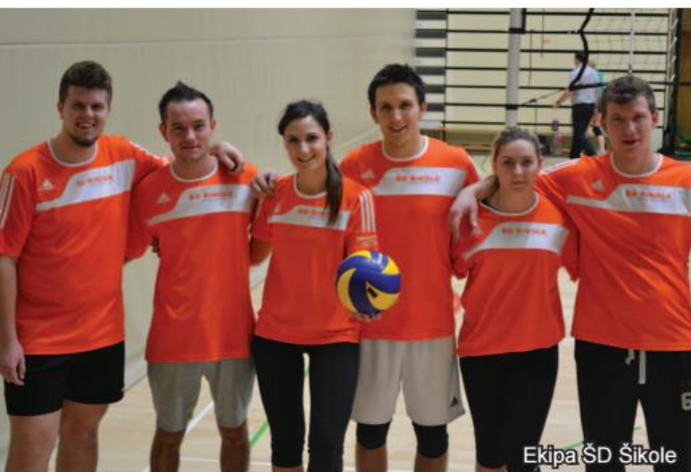
Ekipa ŠD Šikole