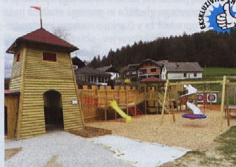
Na Ranču Aladin so z raznimi igrali poskrbeli za dodatno zabavo za otroke.

Poskrbljeno pa je tudi za starše. "Za starše smo čisto zraven igral naredili klopi, na katerih se lahko oddahnemo in opazujejo svoje male vračce pri igri", pove Zupan.