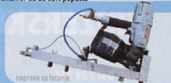
naprava za latanje

Kupovanje pri nas je cenejše, pričajate se!