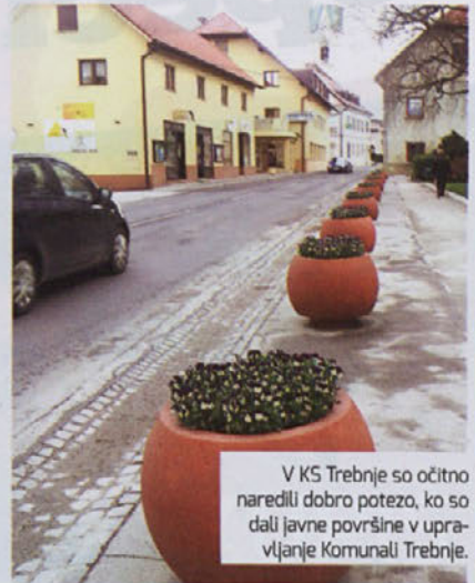
V KS Trebnje so očitno naredili dobro potezo, ko so dali javne površine v upravljanje Komunali Trebnje.