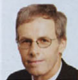
Piše: mag. Janez Slak

Kolumnist(ka) izraža svoje mnenje, ki ni nujno enako z mnenjem uredništva!