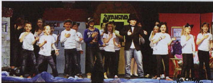
Nastopanje pred občinstvom terja veliko mero poguma, kar pa zna otrokom priti prav v nadaljnjem življenju.