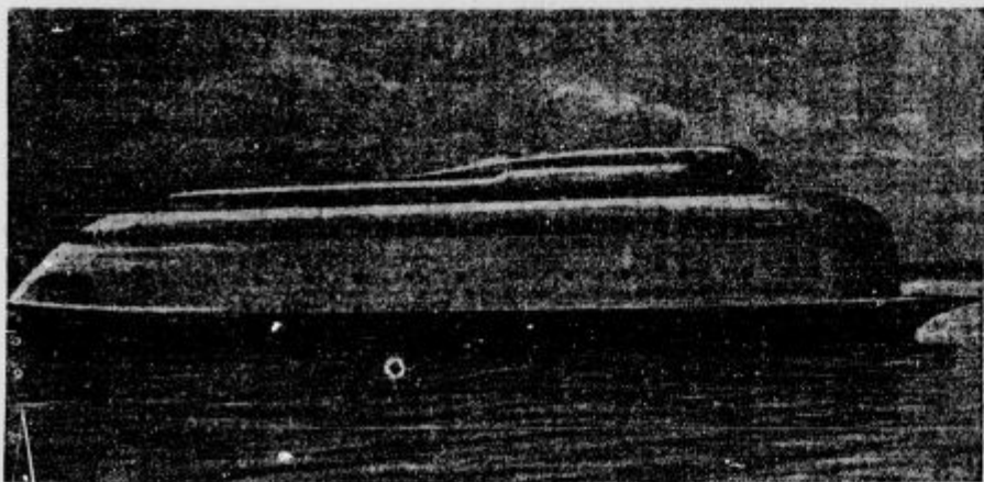
Take-le bodo moderne potniške ladje. Gonila jih bo elektrika.

Težke so te besede, gospodje, toda če pogledamo parlamentarno politično zgodovino sveta, zlasti od začetka svetovne vojne pa do danes, bomo videli, da so ta pooblastila pogosti pojavi v vseh državah in bomo tudi videli, da je tudi parlamentarna praksa kakor tudi pravna teorija vseučiliških profesorjev osvojila možnost take delegacije oblasti, ki v resnici ne pomeni nič drugega kakor prepustitev vladi, da ona gotova določena vprašanja v določenem času uredi, dočim vrhovno kontrolo kljub temu parlament pridrží zase. Vam je vsekakor znana borba, ki se je pred kratkim vršila v Ameriki in ona, ki se je pred nekaj tedni vršila tudi v Franciji. Tudi tam je bila govora o posebnih pooblastilih in ta pooblastila je sprejelo vse ljudstvo z navdušenjem. Če je, gospodje, lahko kaj takega v najbolj demokratičnih