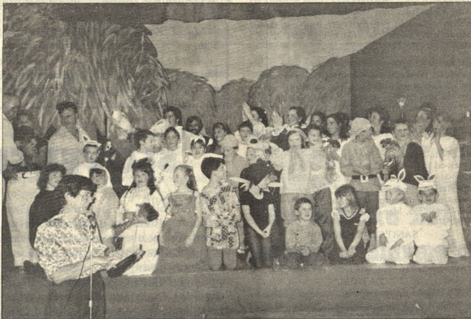
Igralci Pepelke v San Martinu

Upamo, da se bo ta igra ponovila še na kakšnem drugem odru, da jo bodo lahko uživali vsi slovenski otroci.