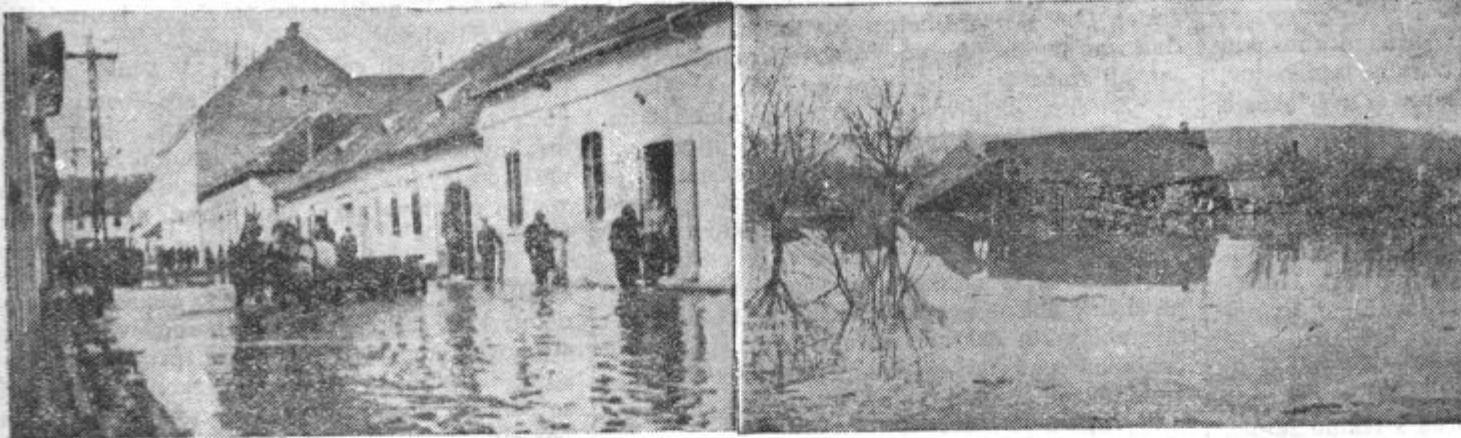
Dva značilna prizora o razdejanju, ki so ga letos povzročile poplave v Vojvodini — najrodovitnejši žitnici Jugoslavije. — O katastrofi sami poročamo v današnji številki lista na 4. strani.

kmetski praznik, združen s tekmo koscev, mladinskim zborovanjem in veselico, proslavo Matije Gubca, združeno z igro »Upor Bohinjcev«. Teh prireditev se je udeležilo nad 8000 ljudi.