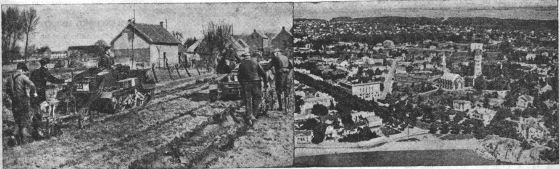
Levo: Angleško vojaštvo pomaga zadaj za fronto francoskim kmetom z lahkiimi tanki pri poljskih delih. — Desno: Pristanišče Hangö, iz katerega se je po mirovni pogodbi morala umakniti finska vojska in ga prepustiti sovjetskim četam

Na našem odru je v nedeljo dne 31. III. t. l. z velikim uspehom igral Zvezin dramatski odsek »Hlapca Jerneja« Zveza kmetov fantov in deklet je s tem naši okolici storila res koristno delo, saj smo na odru videli vsakdanjo človeško tragedijo in lepo igro. Takšnih prireditev bi si še želeli; potrebno je da vsi naši odri prikažejo našim diletantom dobro igro, način igranja, da