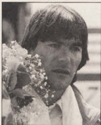
Tomo Česen, človek, ki je prvi premagal južno steno 8515 metrov visokega Lhotseja.

Ne zamudite te edinstvene priložnosti spoznavanja najvišje stopnje alpinizma na svetu; – v četrtek, 24. januarja se udeležite predavanja Toma Česna v Celovcu. Režijski prispevek znaša za odrasle 50, za mladino pa 20 šilingov.