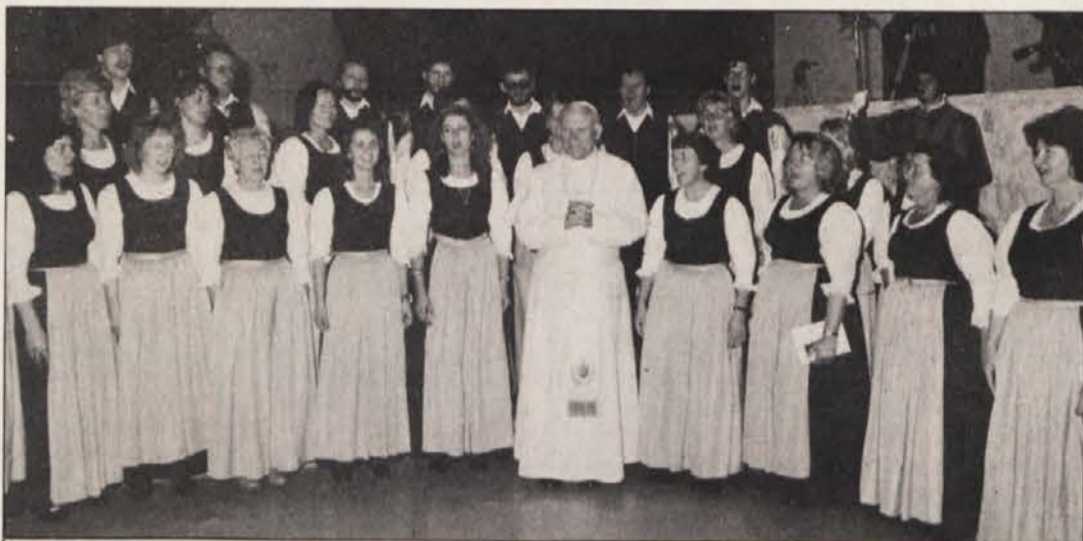
Na novo leto so se člani pevskega zbora J.P. Gallus odpeljali v Rim. Po posredovanju prijatelja v Rimu so jim bila odprta tudi vrata do papeža. Ob obisku so prepevali lepe slovenske pesmi. Papež Janez Pavel II je pevce pozdravil v slovenskem jeziku in izrekel željo „naj vesela pesem brez prestranka doni v Vaših srcih in blagodejno odmeva v Vašem okolju.“ V treh – za Rim prekratkih – dneh, so si lahko ogledali le nekaj najpomembnejših znamenitosti velikanskega mesta in se vsaj malenkostno seznanili s skoraj tritisočletno zgodovino Rima.