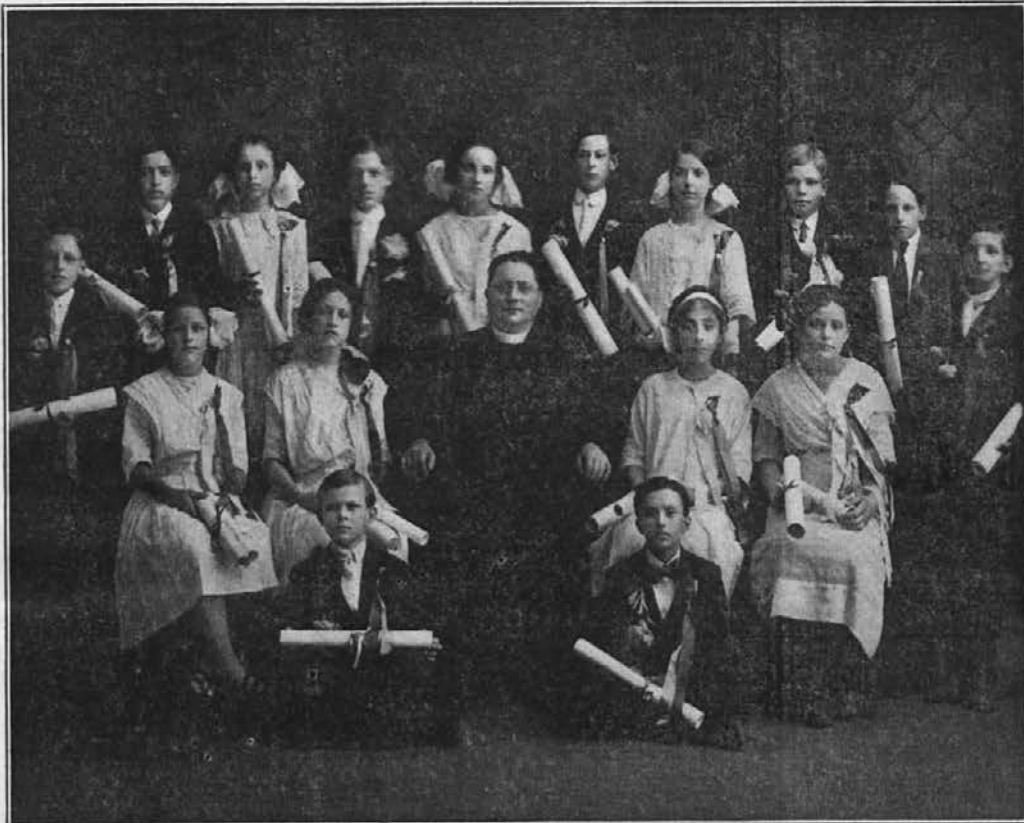
Graduantje in graduantinje slovenske šole sv. Jožefa v Jolietu, Ill. leta 1914.

Sheboygan, Wis. — Primoran sem se oglasiti iz naše lepe in trdne naselbine. Kajti sporočiti Vam imam veliko važnih zadev.