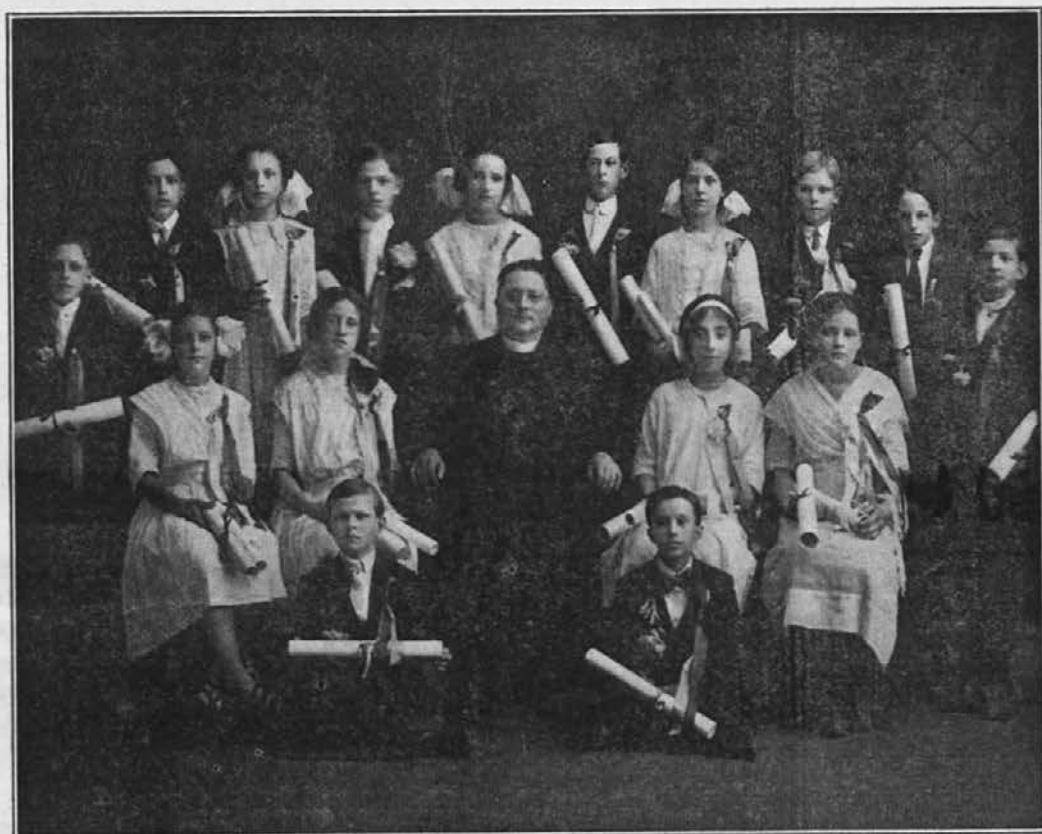
Graduantje in graduantinke slovenske šole sv. Jožefa v Jolietu, Ill. leta 1914.

Sheboygan, Wis. — Primoran sem se oglasiti iz naše lepe in trdne naselbine. Kajti sporočiti Vam imam veliko važnih zadev.