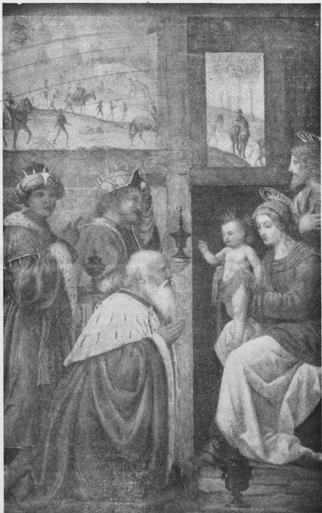
''In Modri padejo predenj, ga molijo, odpro svoje zaklade ter mu darujejo zlata, kadila in mire.''